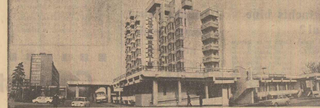
Imagine din centrul municipiului Deva

Rubricile noastre: Dialog cetățesc; În confruntare scrisori și răspunsuri; Faptul divers; Sport; Din țările socialiste; De la corespondenții noștri; De pretutindeni