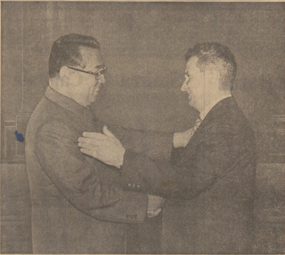
După semnarea tratatului de prietenie și colaborare

Un moment de însemnătate istorică în dezvoltarea raporturilor de colaborare frățească și solidaritate militantă româno-coreene