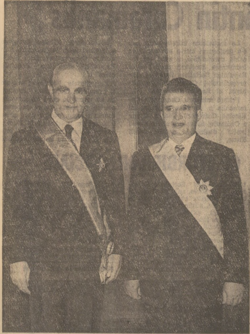
La solemnitatea decorării președintelui Republicii Socialiste România și a președintelui Consiliului de Miniștri al Republicii Elene