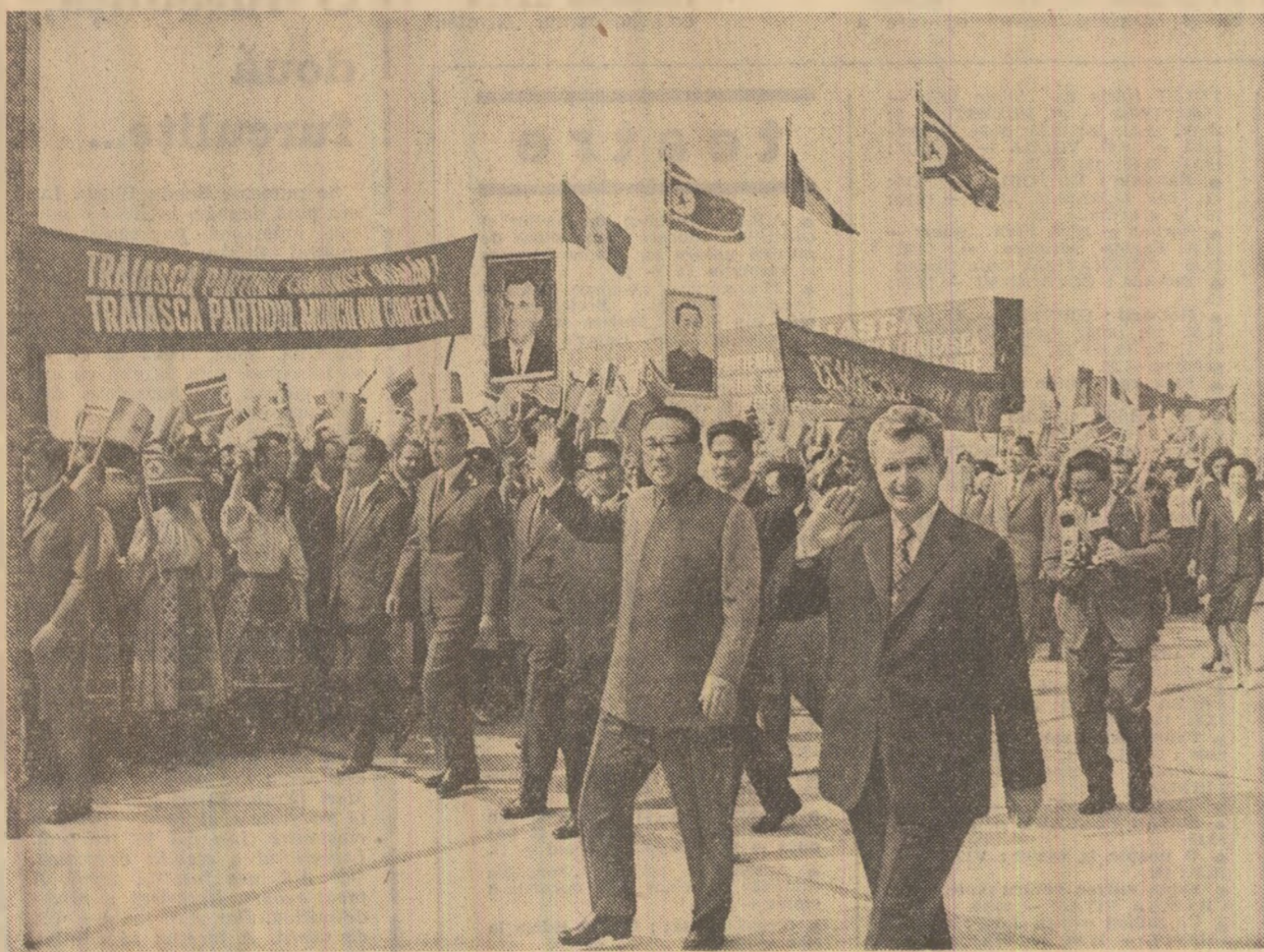
Mii de bucureșteni au salutat cu căldură pe înalții oaspeți