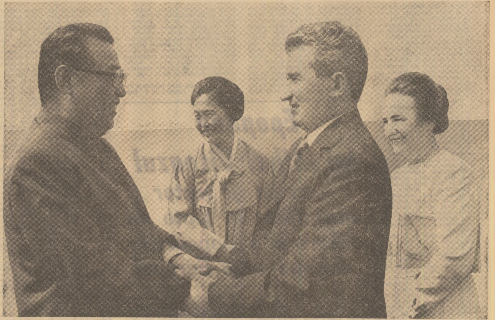
La plecare, pe aeroportul Otopeni