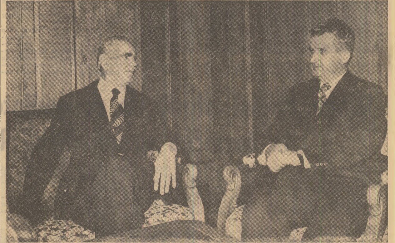
Dineu oficial oferit de președintele Nicolae Ceaușescu în onoarea premierului Republicii Elene