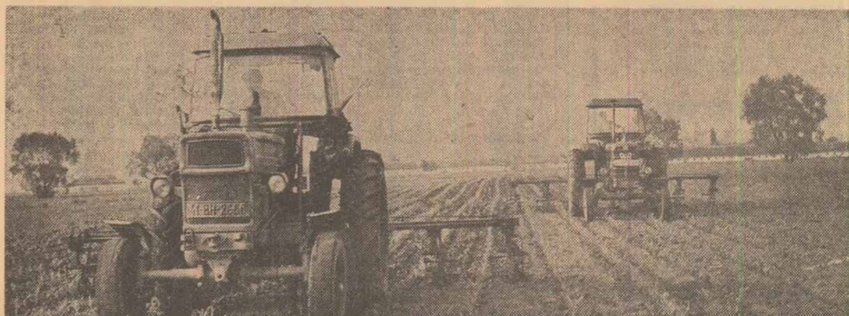
Pe terenurile I.A.S. Valea lui Mihai, județul Bihor, se lucrează intens la întreținerea culturilor

Lucrătorii Truștilui de construcții pentru îmbunătățirea funcției București au pus în funcțiune unitatea I din complexul de irigații Mostiștea, cu o suprafață de peste 20.000 ha. De acest sistem de irigații din județul Ilfov beneficiază 9 unități agricole cu cooperatiste și o întreprindere deosebită la depășirea planului. (Alexandru Mureșan).