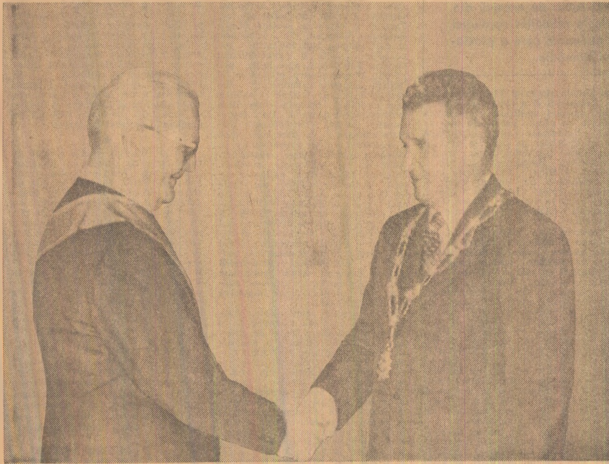
După conferința înaltelor distincții românești și braziliene

NICOLAE CEAUȘESCU Președintele Republicii Socialiste România