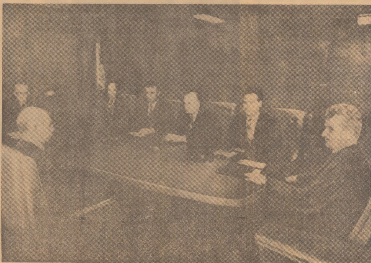
În timpul convorbirilor oficiale

Este întemeiată speranța că eforturi ca acelea ale țărilor noastre pentru lărgirea domeniilor de cooperare vor avea un nobil efect asupra altor popoare și conducători, stimulîndu-i să prefere antagonismului căutarea înțelegerii în cadrul diversității.