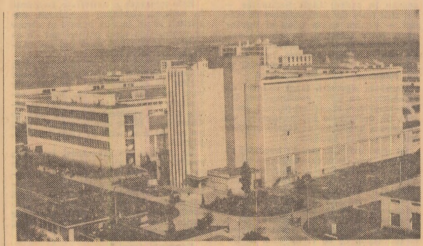
Întreprinderea de fibre și fire sintetice din Sîrbinești

știință, cu propriul fel de a fi, în general? — M-am gîndit că, dacă într-adevăr se muta, nu frustram pe nimeni de nimic. De unde să fi știut că ne minte? Credeam că e vorba de un fel de bunăvoință. Cîteodată, dacă te auzi de cineva, e cu totul altceva... — N-am mai stăruit. Devenind lîmpede că pretinsă năvitate nu era decît travestitul sub care încerca să se ascundă acea mentalitate după care întregul n-ar suferi dacă „parțial”, „din cînd în cînd”, s-ar mai face pe alocuri cite o „derogare”. Trăim într-o lume a sanseilor egale, dar avem dato-