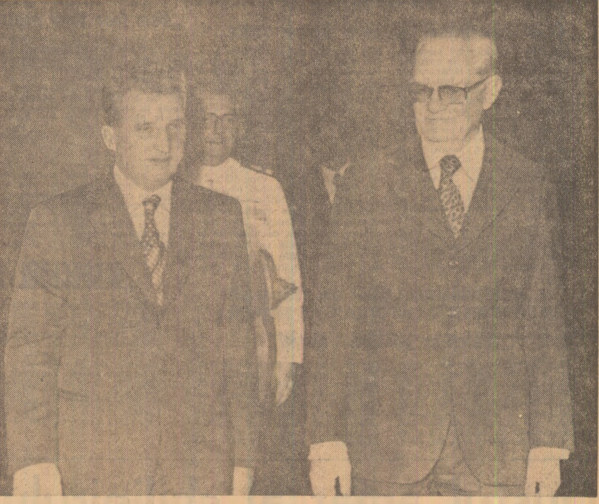
Moment din timpul vizitei protocolare la palatul prezidențial