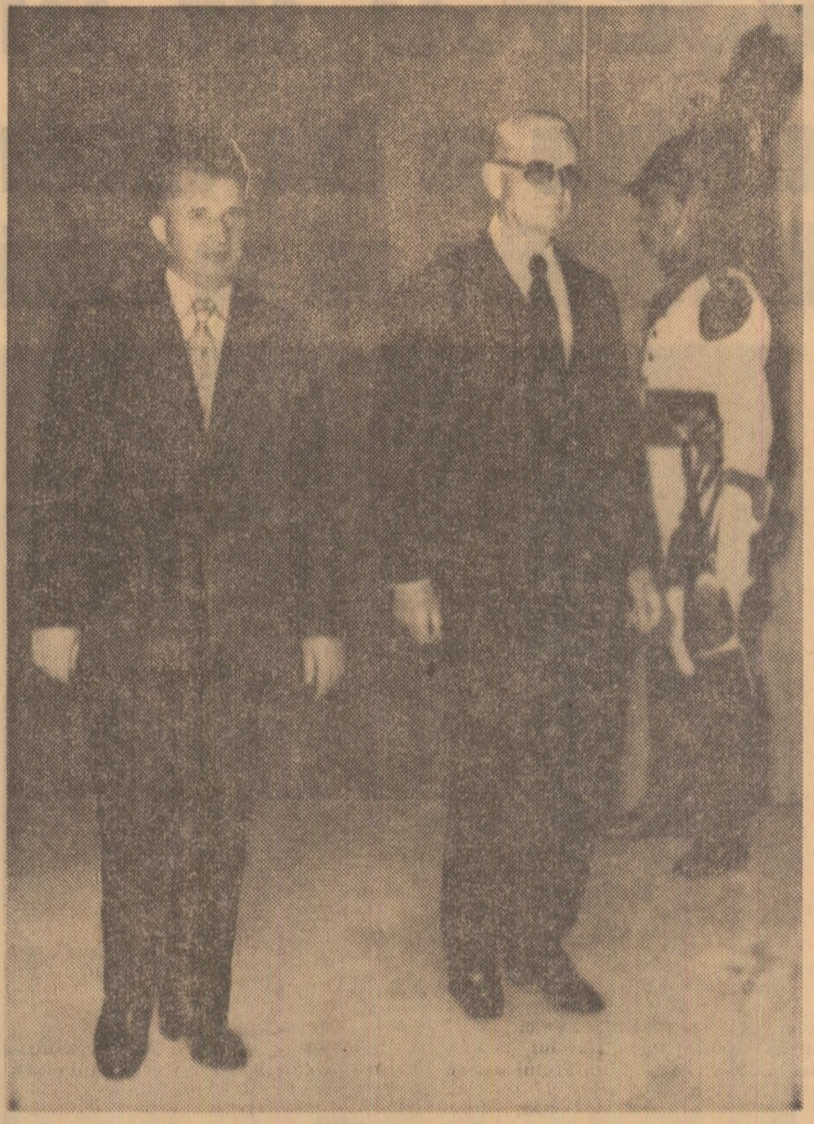
La dineul oficial în onoarea președintelui Nicolae Ceaușescu și a tovarășei Elena Ceaușescu