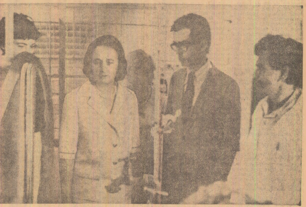
În timpul vizitei tovarășei Elena Ceaușescu la Universitatea federală din Brasília

Complexitatea vieții internaționale actuale impune participarea tuturor țărilor la soluționarea problemelor care confruntă omenirea. Este o necesitate istorică a lumii de azi ca țările mici și mijlocii, țările în curs de dezvoltare, țările nealiniate să aibă un rol mai activ în viața internațională.