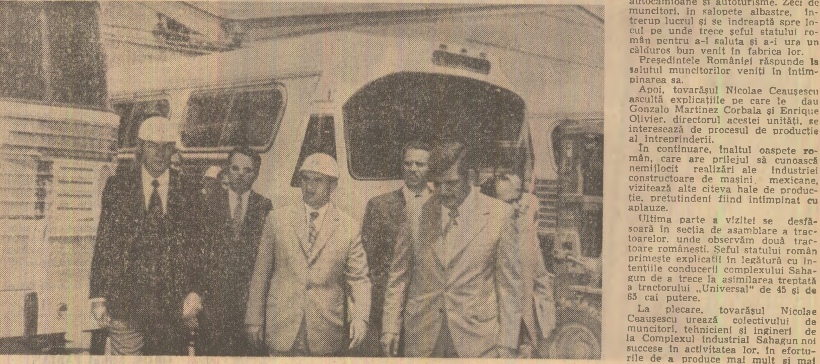
În timpul vizitei la Complexul industrial Sahagun