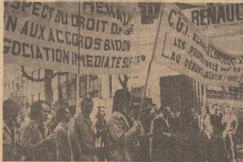
Paris. Demonstrația a lucrătorilor de la uzina „Renault” pentru îmbunătățirea condițiilor de muncă

MADRID 11 (Agerpres). — Secretarul general al O.N.U., Kurt Waldheim, a sosit miercuri la Madrid, ultima etapă a misiunii sale de informare asupra problemei Saharei occidentale. El va avea convorbiri cu generalul Franco și alte oficialități spaniole. După cum se știe, Spania a anunțat decizia de a pune capăt în mod irevocabil prezenței sale în Sahara occidentală și de a transfera puterile cât mai curând posibil. Partea spaniolă nu a indicat încă cuibărită de a merge pe lângă O.N.U. să-și asume responsabilitățile și să încerce găsirea unei soluții, prin convocarea unei reuniuni a celor patru părți interesate — Mauritania, Algeria, Marocul și Spania.