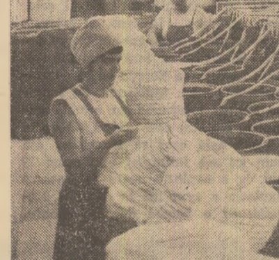
Imagine dintr-una din secțiile întreprinderii „Docan” din Capitală