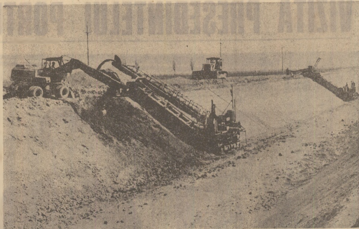
Pe șanțierul de hidroameliorații Giurgiu-Râmzești, județul Ilfov, la executarea lucrărilor se folosesc utilaje moderne, de mare randament

Realizarea planului la fiecare cultură agricolă în parte — atât ca suprafață însămînțată, cit și ca volum al producției ce urmează a se realiza — impune folosirea rațională și deplină a pămîntului, buna gospodărire a fondului funciar.