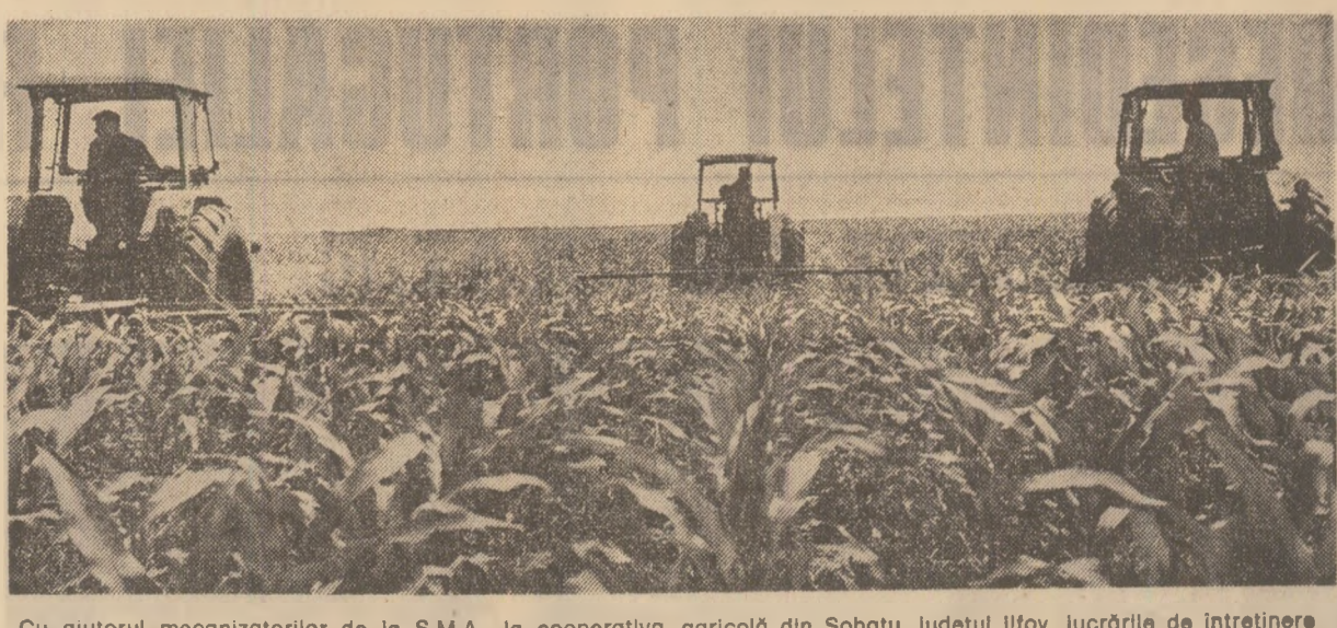
Cu ajutorul mecanizatorilor de la S.M.A., cooperativa agricolă din Sohatu, județul Ilfov, lucrările de întreținere a culturilor sînt executate în ritm accelerat

Ginduri despre pictură de Alexandru CIUCURENCU