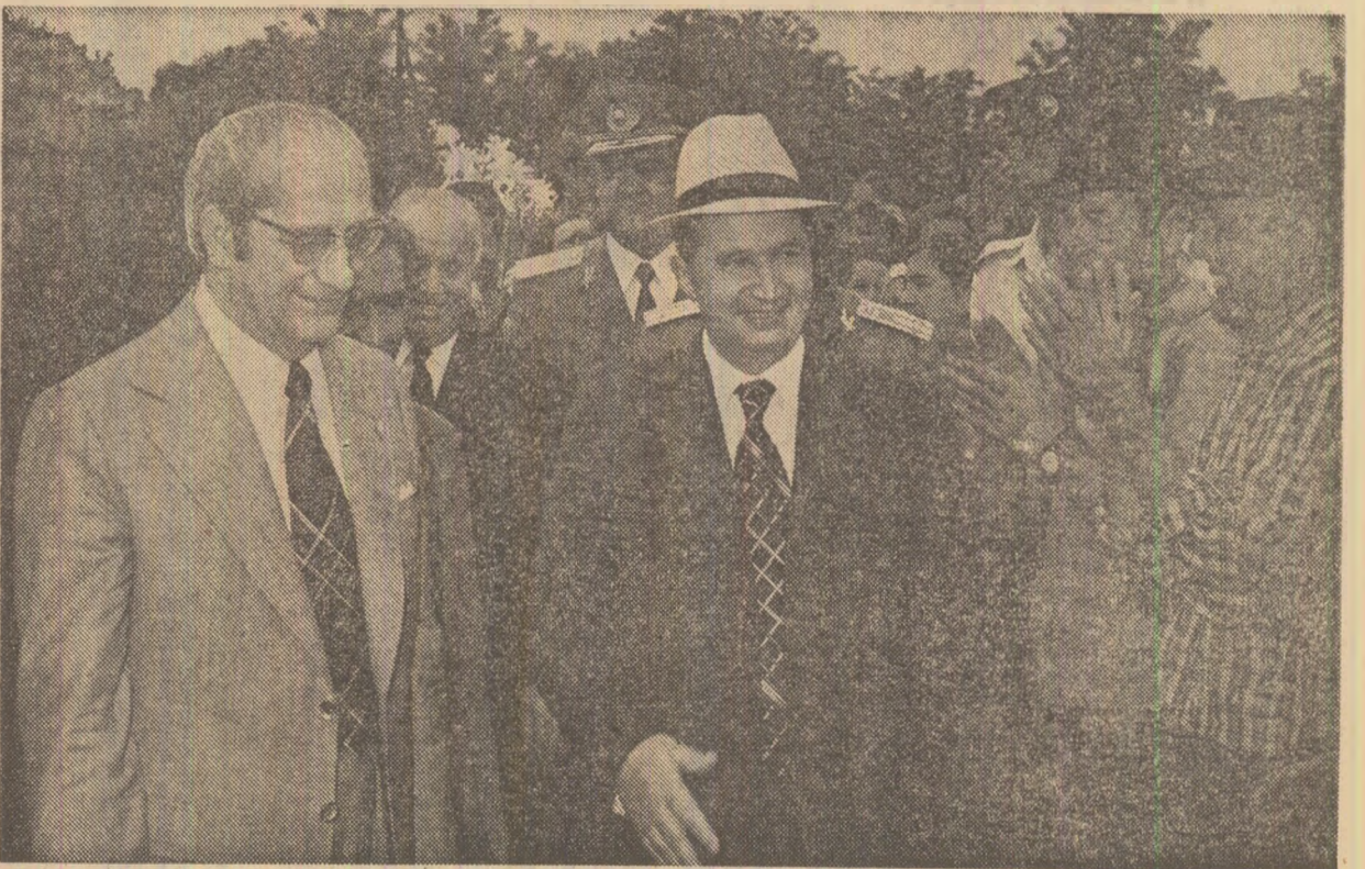
În mijlocul cooperativelor din comuna Gîrbovi