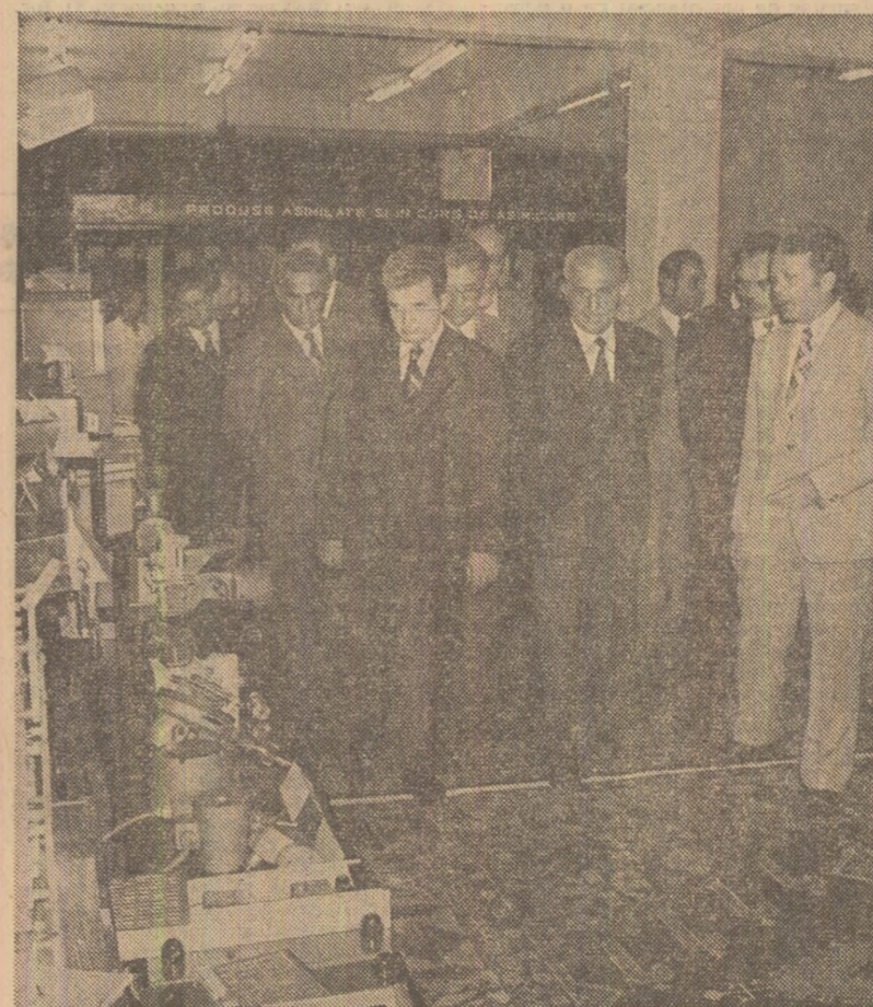
La fabrica de cinescoape