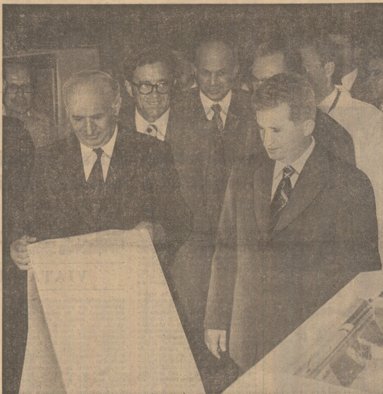
Se vizitează fabrica de calculatoare

Spiritul de profundă înțelegere dintre partidele și țările noastre, înfrățite în construcția socialistă, caracterizează desfășurarea convorbirilor româno-bulgare la cel mai înalt nivel