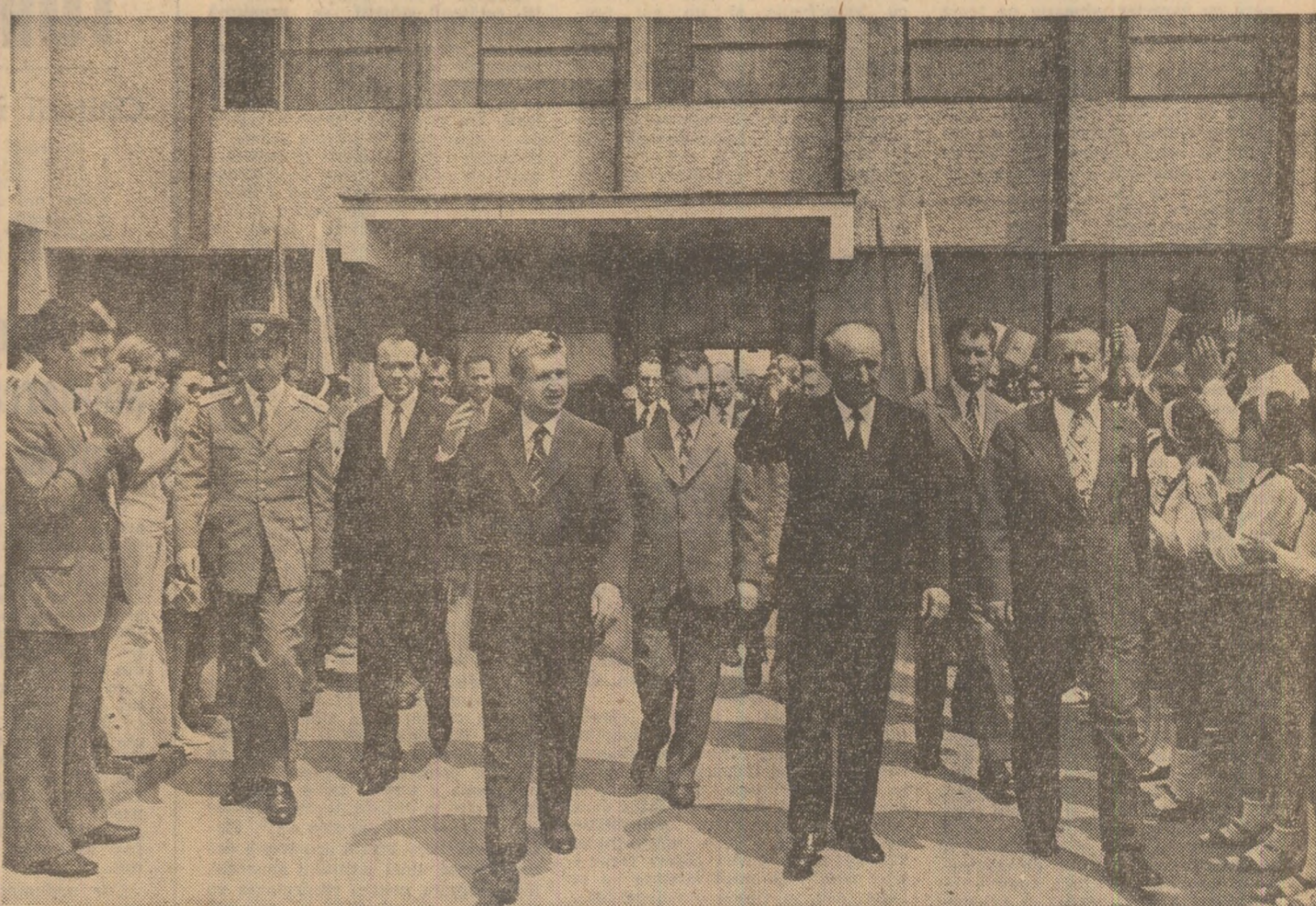
Imagini din timpul vizitei înaltor oaspeți în întreprinderile bucureștene

(Urmare din pag. 1) dintre tovarășii Nicolae Ceaușescu și Todor Jivkov, care, ca și întâlnirile