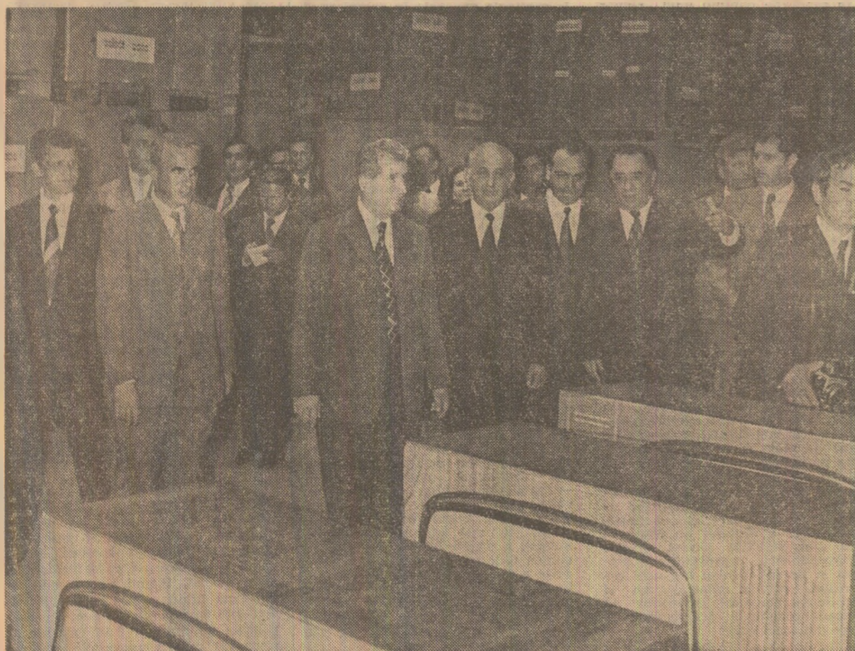
Bune aprecieri pentru produsele întreprinderii „Electronica”