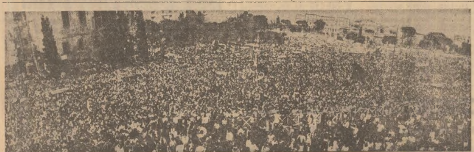
Aspect de la grandioasa manifestație populară, care a avut loc la Roma, consacrată succesului în alegeri al P.C.I., al forțelor de stînga

Există o evasi-tradiție, de fapt, bine întemeiată, — de a se atribui consuliilor electorale cu caracter regional — administrativ-local, semnificativă unor testări politice de valoare generală, pe ansamblul entităților naționale. Și într-adevăr, astfel de consuliuri pot degaja concluzii de însemnătate determinată în privința opiniilor populare.