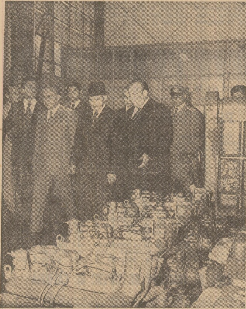
Intr-una din secțiile uzinei de tractoare

Coloana de mașini urcă apoi spre stațiunea Poiana Brașov, străbătînd una din cele mai pitorești artere din țară. De aici se deschide o splendidă panoramă a orașului Brașov și a Tării Biserii.