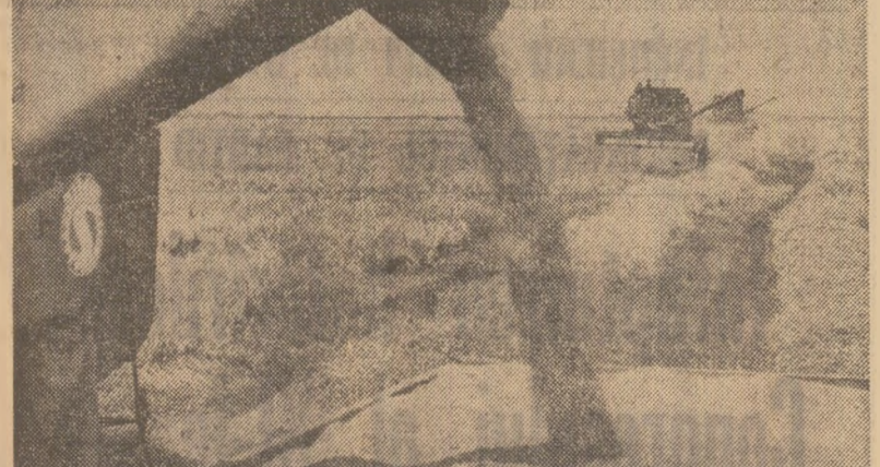
Încă de la sfîrșitul săptămînii trecute, pe terenurile Institutului de cercetări pentru cereale și plante tehnice Fundulea, județul Ilfov, a început recoltatul orzului. La ferma Săuc, unde s-au cultivat 120 ha cu orz, au fost concentrate 17 combine (fotografia de sus). Pînă ieri în fermele Institutului se recoltează orzul de pe 250 ha, lucrarea urmînd a se încheia azi. Producția obținută fiind destinată pentru sămînță este încorcodată direct din combine în autocamioane și transportată la instalația de condiționare (fotografia de jos)