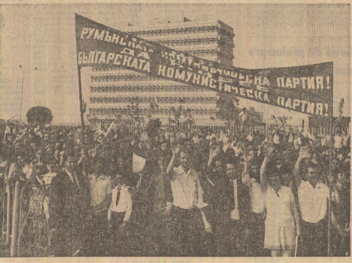
Primire călduroasă — expresie a sentimentelor de prietenie frățească față de poporul bulgar