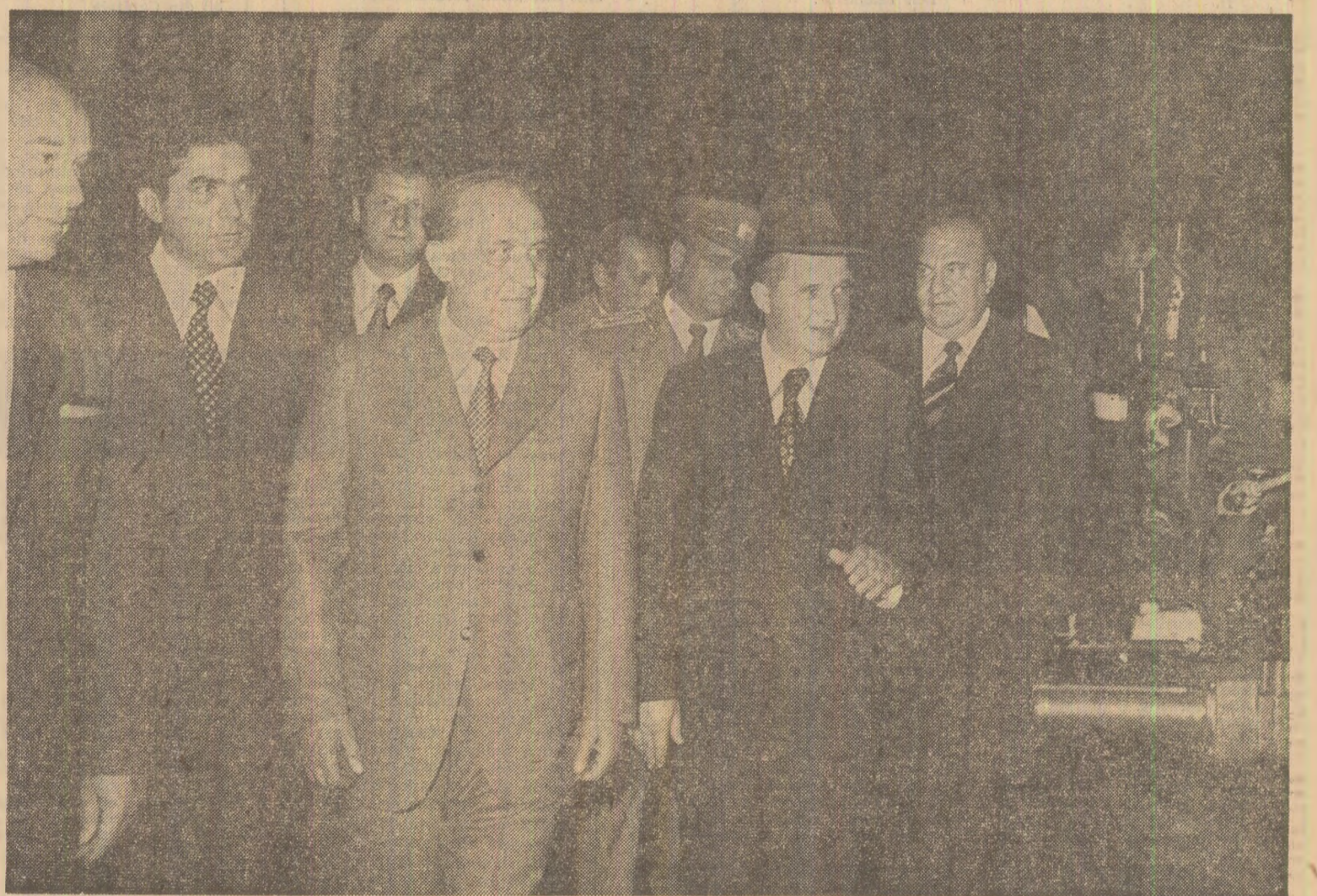
Cunoașterea tehnologiilor moderne de producere a tractoarelor românești