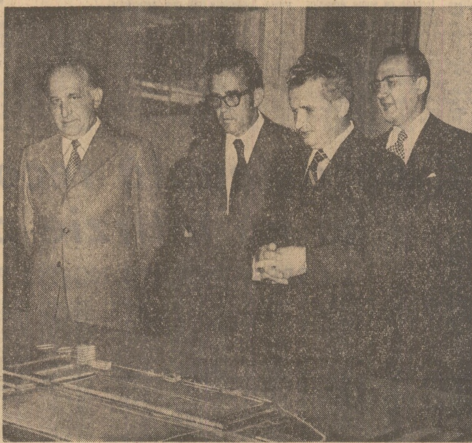
Printre constructorii de autoturisme piteșteni

Mii și mii de oameni ai muncii au salutată cu deosebită căldură pe cei doi conducători de partid și de stat, exprimîndu-și astfel satisfacția și sprijinul deplin pentru dezvoltarea în continuare a colaborării multilaterale, a cooperării frățești dintre România și Bulgaria pe drumul rodnic al socialismului