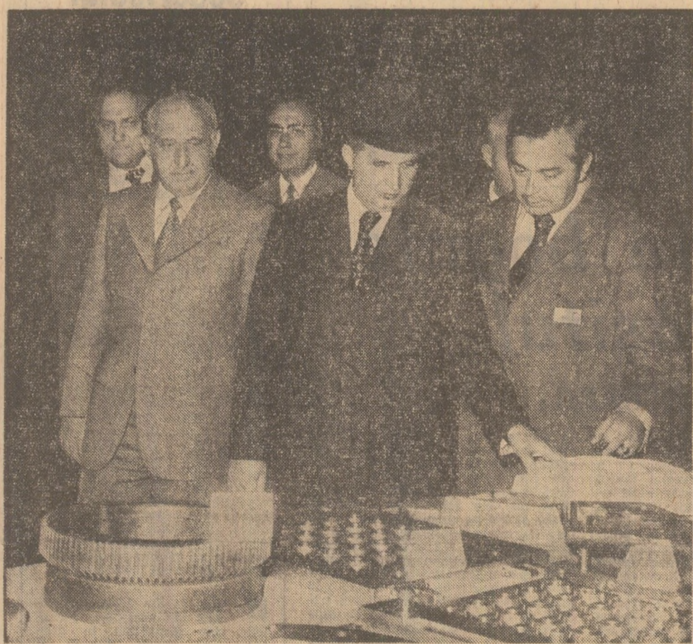
La întreprinderea „Tractorul” Brașov