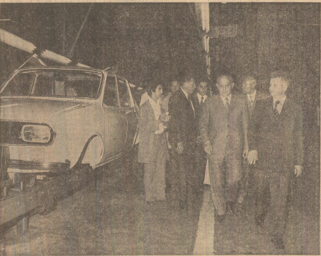
În secția de montaj general a întreprinderii de autoturisme

aeroport, au salutat cu căldură, eu sentimente de înaltă stimă și prețuire pe tovarășii Nicolae Ceaușescu și Todor Jivkov, ovățînd pentru prietenia româno-bulgare.