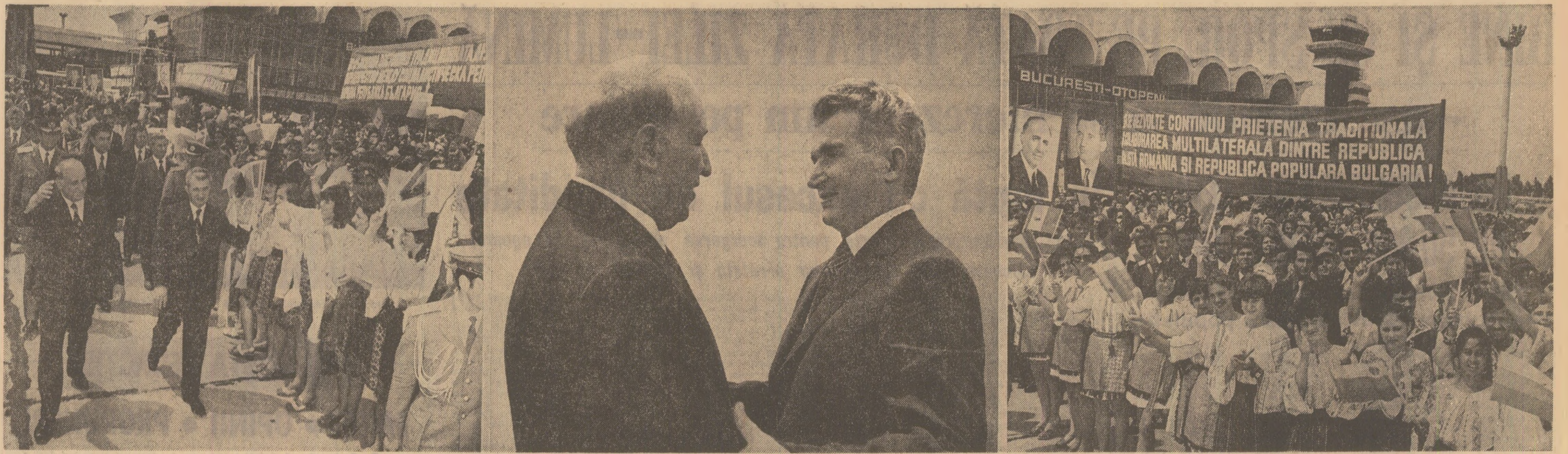
Imagini de la ceremonia plecării înălților oaspeți