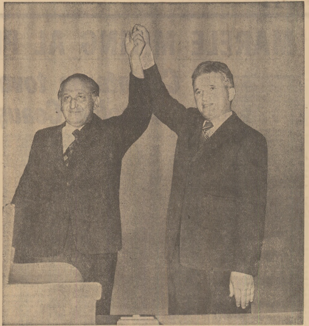
Moment din timpul marelui miting al prieteniei româno-bulgare