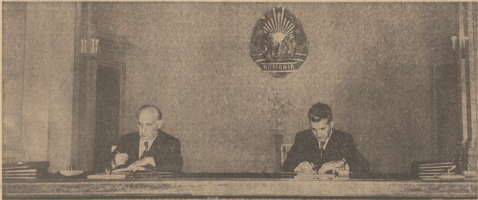
Solemnitatea semnării documentelor