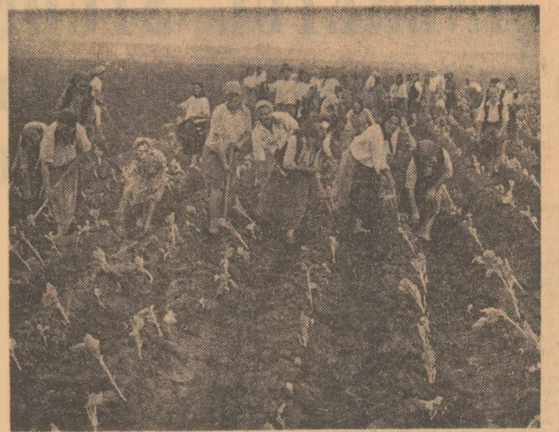
Pe terenurile de pe care a fost strins recolta, membrii cooperativei agricole din comuna Plosca, judetul Telemorman, planteaza acum varza de toamna

George MIHAESCU corespondentul 'Scintei'