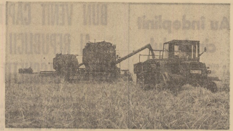
La recoltat, în lanurile I.A.S. Zimnicele, județul Teleorman

de altfel, încă din prima zi s-a înregistrat o viteză la recoltat de 3100 ha, cu 500 ha mai mult decît era preconizată inițial. Cu prilejul raidului, am fost în cele 6 unități de pe raza consiliului intercooperatist Grui. Prețutind se muncea cu spor. Mecanizatori, tractoriști și aceste unități muncesc sub lozina: „Cu fiecare tractor care tractează o combină să arăm zilnic 2 ha teren”. Cum este posibil? Dimeținea, la primele ore, înainte de intrarea