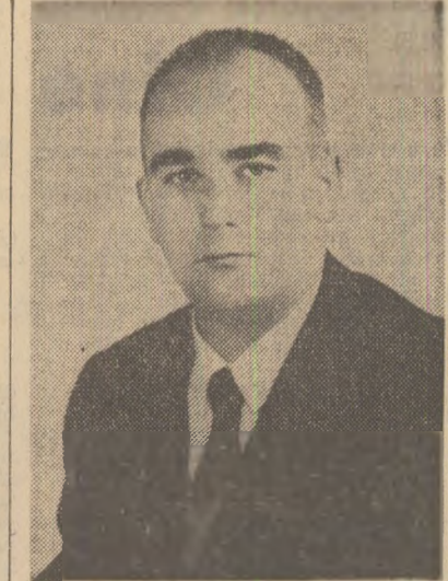
Michele Righi, căpitan regent, s-a născut la San Marino, la 26 aprilie 1923, într-o familie de agricultori, urmîndu-și studiile în școlile sanmarineze. După război intră în serviciul administrației publice, în cadrul spitalului de stat.

Activitatea politică a început-o în anul 1965, în cadrul Federației Tineretului Socialist Sanmarinez. În 1969 este ales membru al Comitetului Central și al Direcțiunii Partidului Socialist Sanmarinez. În 1974 este ales membru al Parlamentului. A avut, de asemenea, un rol activ în viața sindicală, în calitate de secretar al Federației lucrătorilor din domeniul public.