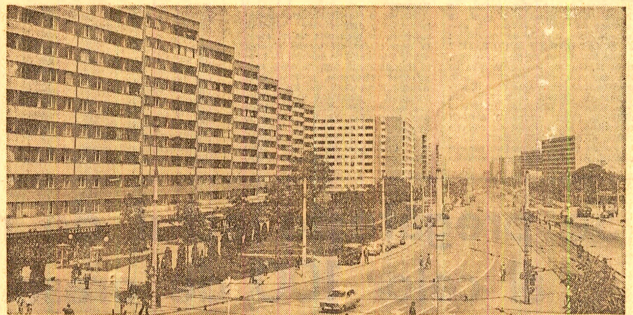
Vedere de pe noua Colentina

Au mai adresat telegrame cadrele didactice din județul Satu-Mare, din sectorul 3 al Capitalei, Comitetul sindicatului din învățământ din municipiul Ploiești și alte colective de cadre didactice.