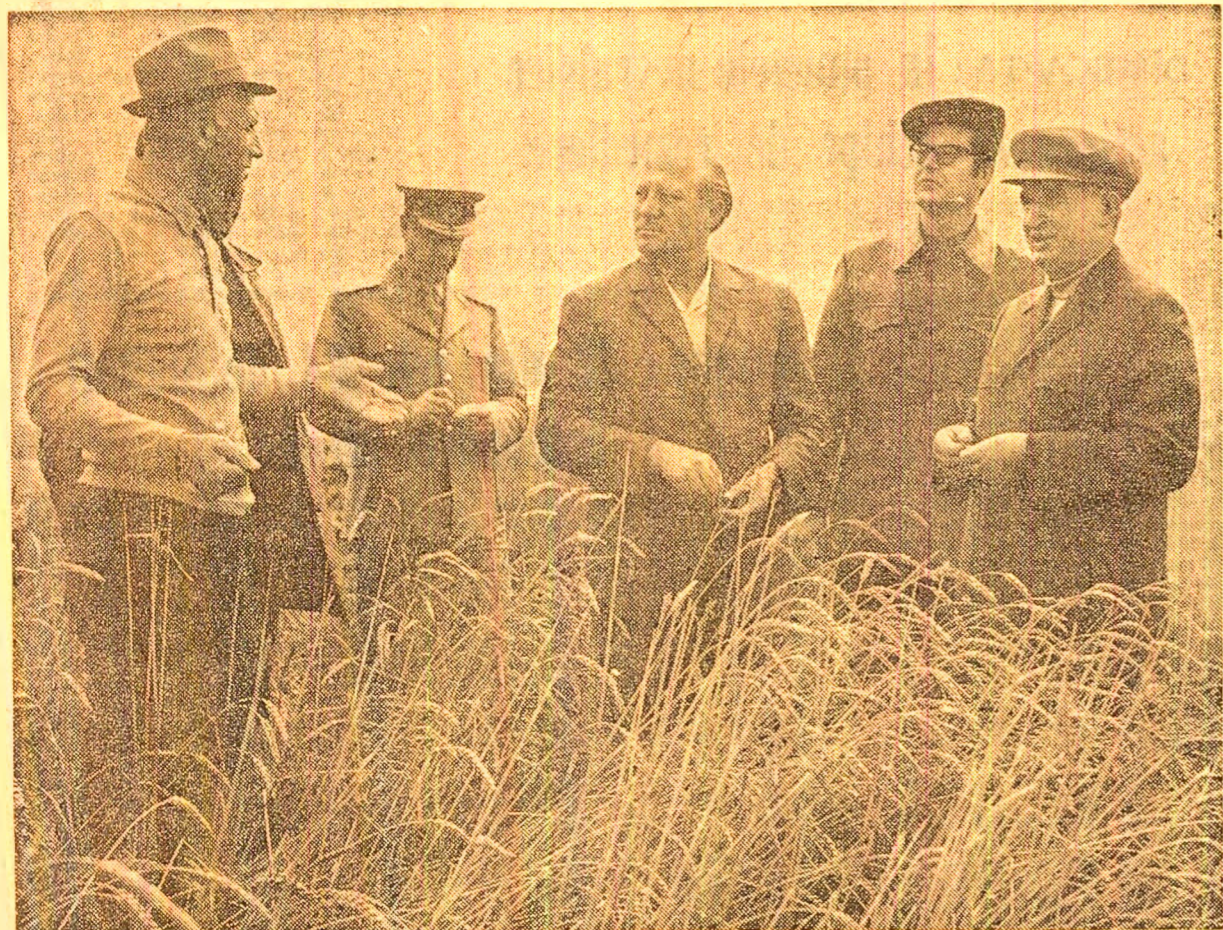
În mijlocul ogoarelor ialomițene

COMUNICAT COMUN privind vizita oficială în România a căpitanilor regenți ai Republicii San Marino IN PAGINA A V-A