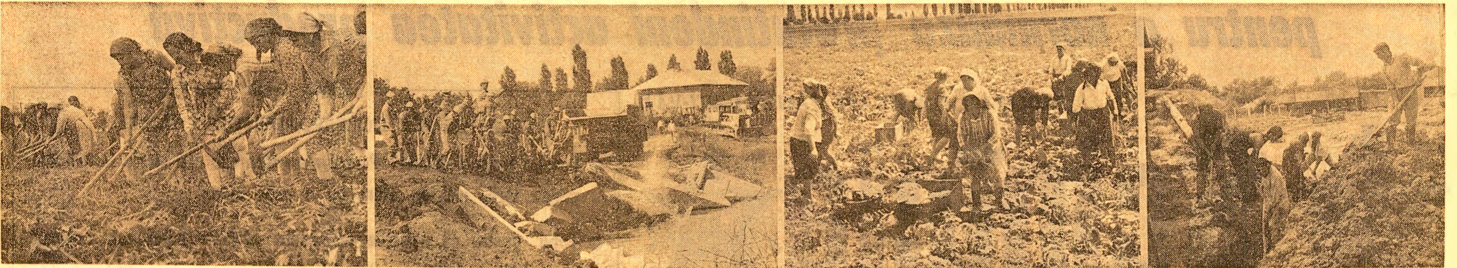
În toate zonele afectate de revărsarea apelor continuă acţiunea avînd ca scop revenirea la normal a activităţii. Obiectivul aparatului fotografic a reţinut câteva aspecte mai semnificative. După retrogradarea apelor, în grădina de legume a cooperativelor agricole din Hăbeni, judeţul Dimboviţa, au fost reluate lucrările de întreţinere a culturilor (fotografia nr. 1). Pentru a stăvilii revărsarea apelor, o unitate militară acţionează cu energie în zona lacurilor Crevada-Buftea, judeţul Ilfov (fotografia nr. 2). După ce cu două zile în urmă, în această grădina, cooperatorii din Blejoi — Prahova adăpu şanţuri pentru evacuarea apelor, acum de aici se trimit spre pieţele Ploieştiului între 10 şi 13 tone de varză şi cartofi pe zi (fotografia nr. 3). Pe unele terenuri, apa continuă să bîlţoască. În vederea evacuării ei, la Mătoşaru-Dimboviţa continuă să fie săpate şanţuri de scurgere (fotografia nr. 4).