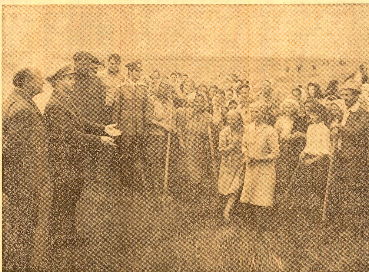
Dialog de lucru cu cooperatorii

După numai câteva minute de zbor, elicopterul prezidențial aterizează din nou, de data aceasta pe localitatea Lunca, situat în perimetrul terenurilor cooperatived agricole de