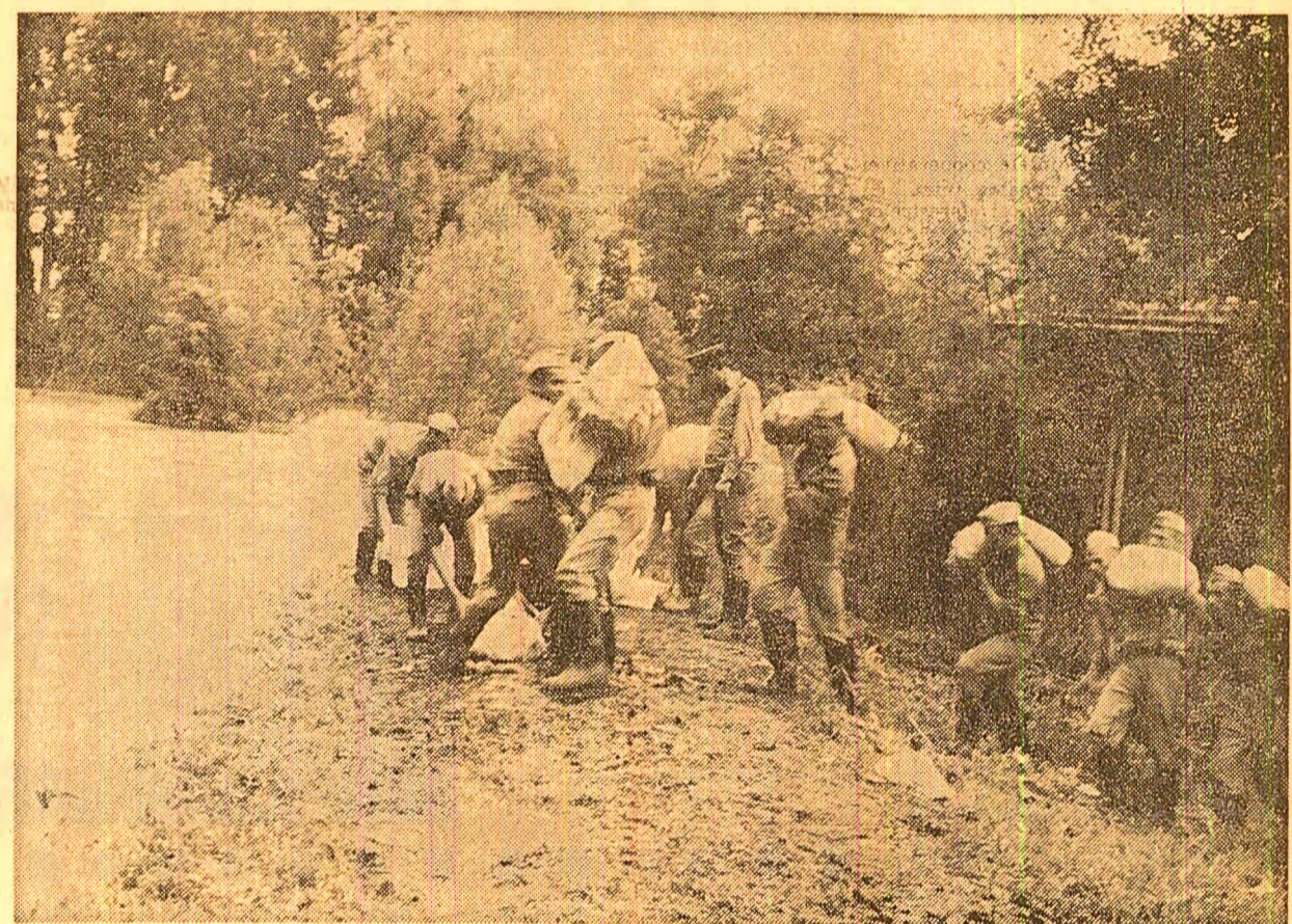
Militarii construiesc un dig pentru a apăra I.A.S. „30 De cembrie” din județul Ilfov și gospodăriile catînenilor de furia apelor Argeșului