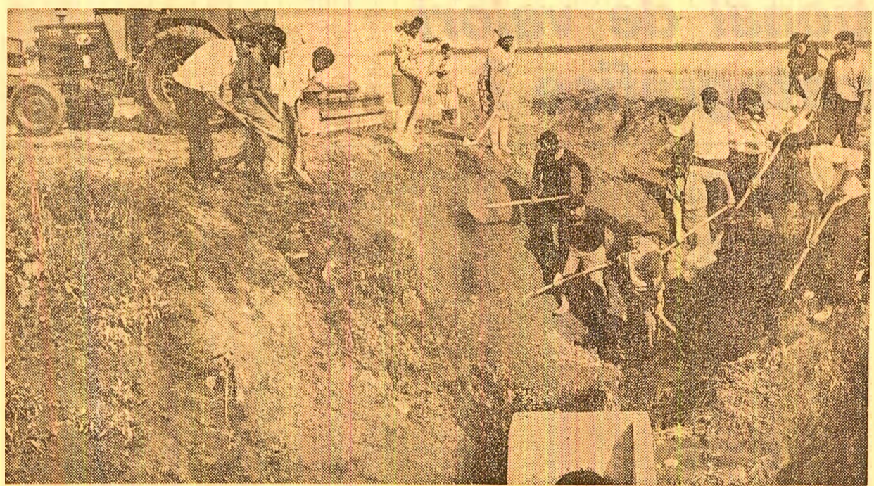
O legătură între canalele de desecare — și apa are cale liberă spre matca din care s-a revărsat. Aspect surprins la hotarul cooperativei agricole din Bîlcuiești, județul Dimbovița.