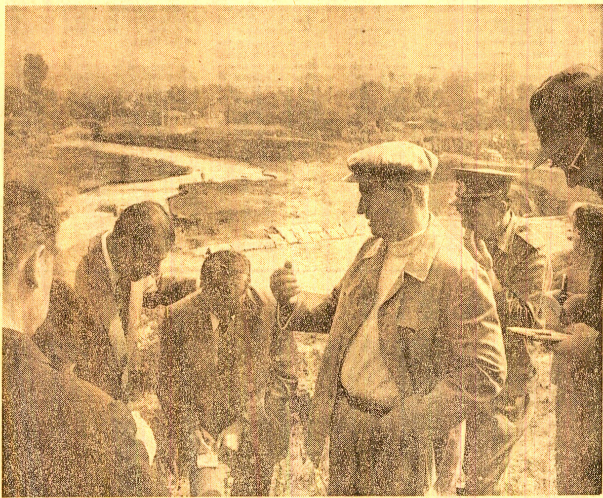
Discuții și recomandări concrete, cu prilejul controlării zonei Roșu-Ciurel

Tovarășul Nicolae Ceaușescu cere, totodată, să se pună la punct un sistem mai eficient de pază a amenajărilor și de urmărire a debitelor, de informare și avertizare operativă asupra eventualelor pericole. Acestui organism îi vor reveni, de asemenea, răspunderi și pe linia controlului poluării apelor. Va trebui să revedem — arată tovarășul Nicolae Ceaușescu