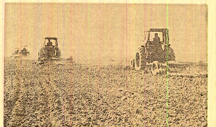
La Sîntulham, județul Hunedoara, se pregătește terenul pentru însămintarea culturilor duble