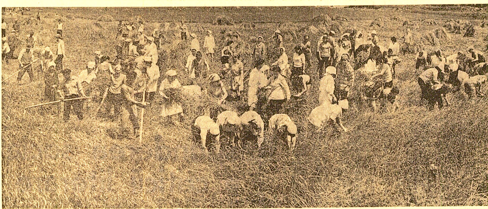
Oamenii au împinzi lanurile pe porțiunile cu griu căzut și teren moale, acolo unde nu pot intra combinele. Secvență din bădălia recoltei la cooperativele agricole Bolintin, județul Ilfov, unde se poate spune că „satul s-a mutat în câmp”.