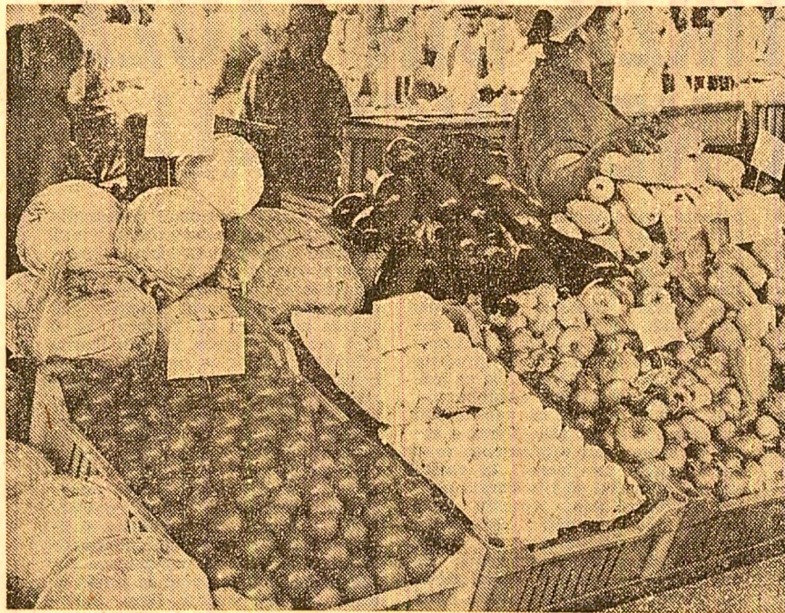
La 22 iulie 1975, o nouă tragere specială LOTO

Administrația de Stat Loto-Pro-nosport organizează o nouă tragere specială LOTO în ziua de 22 iulie, la care se vor atribui numeroase și importante premii în bani, autoturisme Dacia-1300 și Skoda S 100, precum și excursii în R. P. Bulgaria, R. P. Polonă și Uniunea Sovietică. În total, se vor extrage 58 de numere câștigătoare. Participarea se face cu bilete de cîte 2 lei, 5 lei și 15 lei, varianta de 15 lei avînd dreptul de participare la toate extragerile. Se vor efectua 7 extrageri în 3 faze, după cum urmează: faza I obisnuită (2 extrageri: prima de 9 numere din 90 și a doua de 9 numere din restul de 81); faza a II-a suplimentară (3 extrageri: prima de 5 numere din 90, a doua de 6 numere din 90 și a treia de 7 numere din 90); faza a III-a specială (2 extrageri: prima de 10 numere din 90 și a II-a de 12 numere din restul de 80 rămase în urnă). După urnea biletelor câștigătoare se va face pînă în ziua de sîmbătă 26 iulie 1975 la ora 13, în orașele reședință de județ și pînă vineri 25 iulie 1975, la ora 13, în celelalte localități.