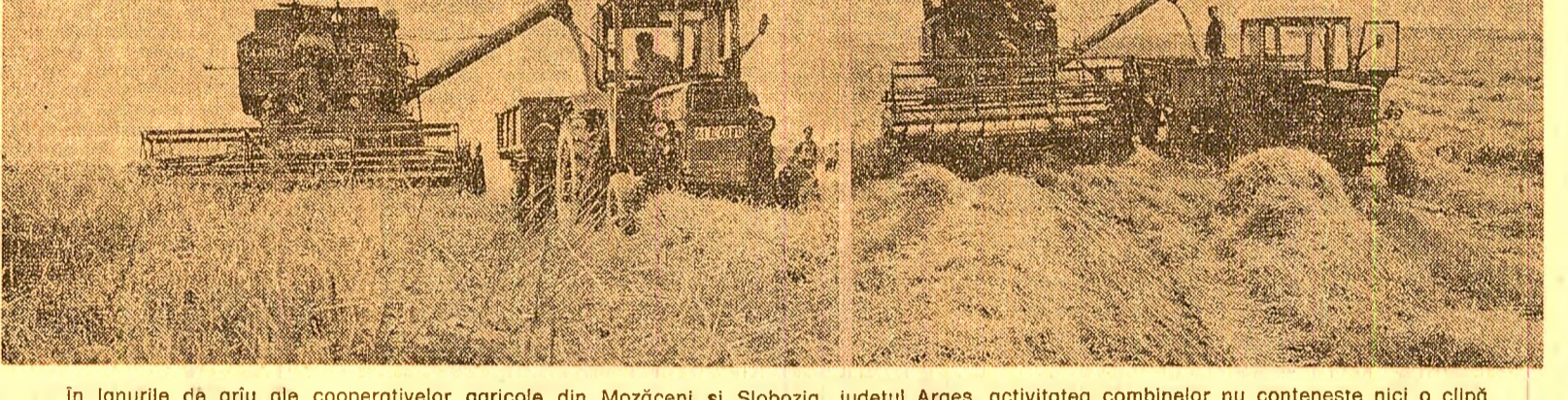
În lanurile de grâu ale cooperativelor agricole din Mozăceni și Slobozia, județul Argeș, activitatea combinelor nu conține nici o clipă