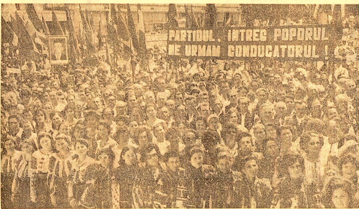
La adunarea populară din Suceava

Timp de două zile în Moldova, înconjurat cu dragoste și stimă, secretarul general al partidului a studiat, împreună cu organele locale de partid și de stat, cu specialiști, cu numeroși oameni ai muncii, soluțiile optime pentru punerea în valoare a tuturor rezervelor în vederea obținerii unor producții suplimentare, îndeplinirii exemplare a prevederilor cincinalului 1971-1975, pregătirii temeinice a cincinalului viitor