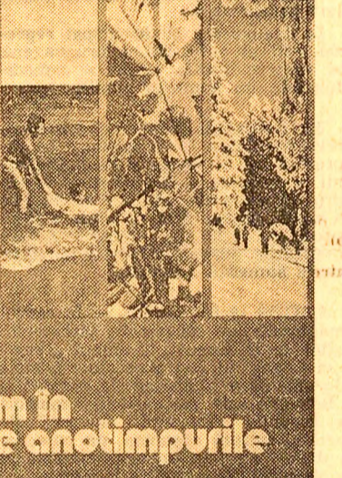
turism în toate anotimpurile