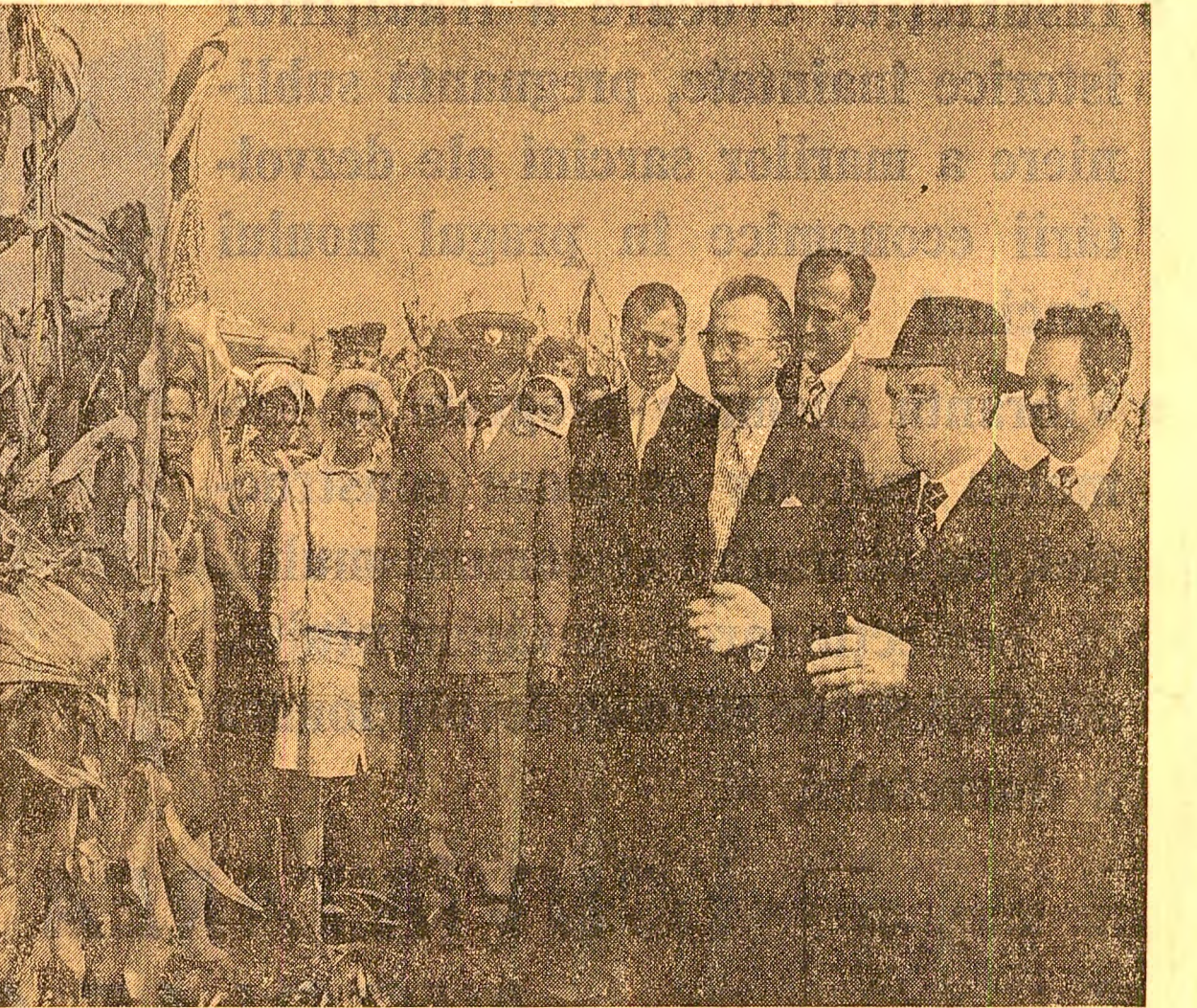
La Poiana Mare: Recolta este bună, dar se poate realiza și mai mult

Aici, ca de altfel pe întregul tra-seu al vizitei, tineretul din cetatea Bănei a făcut secretarului general al partidului o primire plină de entuziasm, scandînd îndelung „Ceaușescu-P.C.R.”, întonînd dîncețe patriotice. În aceste vibrante ma-nifestări de dragoste și prețuire și-au găsit expresie recunoștința fierbîntă pe care o poartă partidul, secretarul general, pentru educarea viitoarelor generații de specialiști, hotărîrea de a se prezăti temeinic pentru îndepli-nirea sarcinilor de mare răspunde-re ce le vor reveni în edificarea so-cialismului multilateral dezvoltat pe pămîntul patriei.