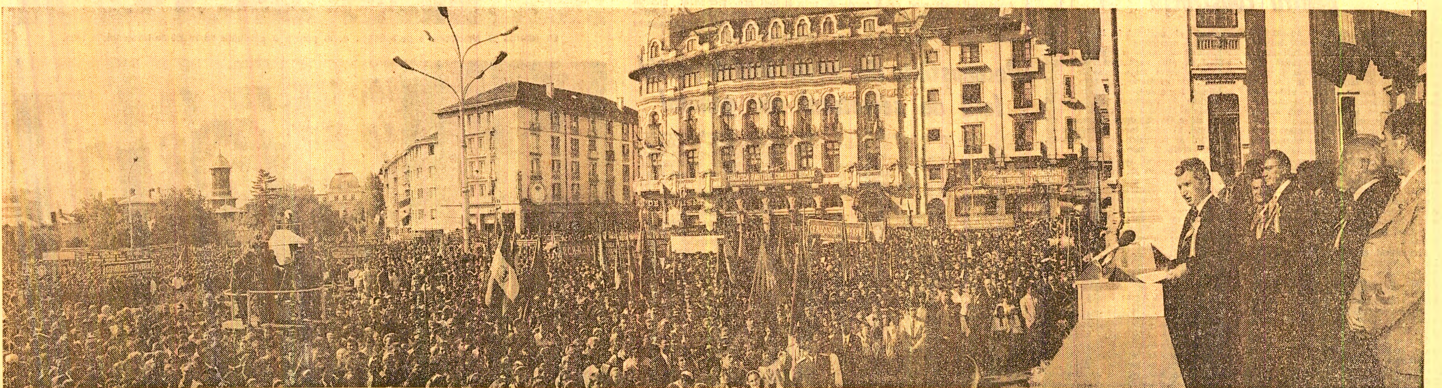
În timpul marii adunări populare