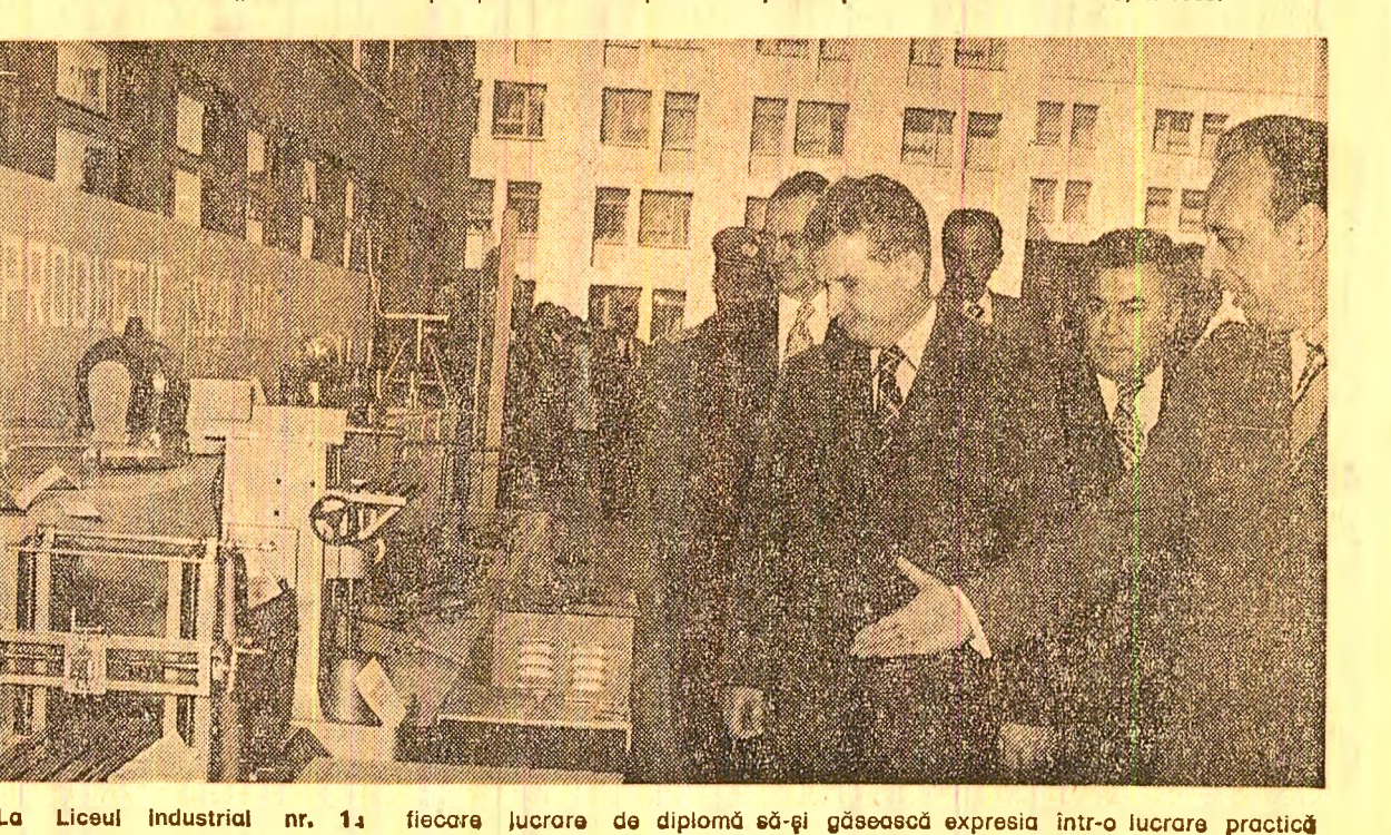
La Liceul Industrial nr. 1: fiecare lucrarea de diplomă să-și găsească expresia într-o lucrare practică