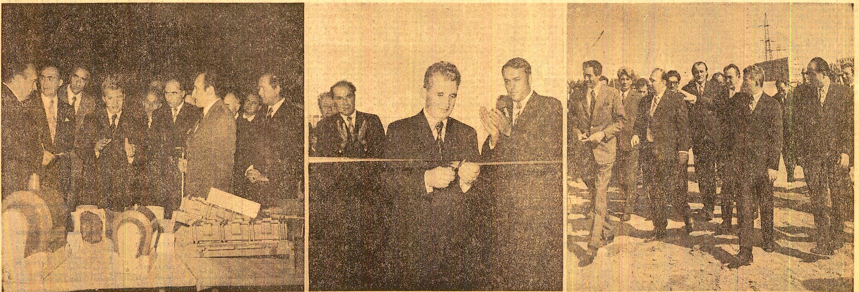
Trei momente semnificative din timpul vizitei pe platforma industrială de est a Craiovei: 1. Indicații prețioase pentru sporirea și diversificarea produselor la Electroputere; 2. Inaugurarea noului local al Facultății de Electrotehnică; 3. Pe șantierul întreprinderii de utilaj greu: un îndemn la bună gospodărie a spațiilor pentru construcții

la fel ca toți cetățenii patriei noastre socialiste, vor face totul pentru a-și îndeplini și în următorul cincinal sarcinile de mare răspundere care le revin. Sînt convins că va veți prezenta și în 1980 cu planul îndeplinit, că veți ocupa un loc fruntaș în marea întrecere între toate organizațiile de partid, între toate județele țării noastre. Aș dori să ocupăți locul unu, dar știu că e o întrecere grea; depinde de comitetul județean de partid, depinde de comunități, de tineret, de dumeavoastră toți, de fiecare la locul său de muncă, pentru a putea ocupa, dacă nu primul loc, dar un loc cit mai demn în această mare întrecere pe plan național, sporindu-vă contribuția la dezvoltarea socialistă și înaintarea spre comunism a patriei noastre. (Aplauze puternice, prelungite; se scandează: „Ceaulescu — P.C.R.”). Cu această convingere, vă urez tuturor multă sănătate, noi și noi succese și multă fericire! Urez, totodată, cadrelor didactice, studenților și elevilor din învățămîntul de toate gradele succese tot mai mari, multă fericire și sănătate! (Aplauze puternice, prelungite; cei prezenți la marea adunare populară aclamă îndelung pentru partid, pentru Comitetul Central, pentru secretarul general al partidului, tovarășul Nicolae Ceaulescu).