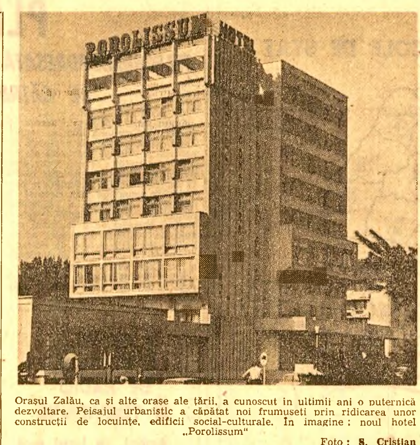
Orașul Zălau, ca și alte orașe ale țării, a cunoscut în ultimii ani o puternică dezvoltare. Peisajul urbanistic a căpătat noi frumuseți prin ridicarea unor construcții de locuințe, edificii social-culturale. În imagine: nou hotel „Porolissus”.

Nu o dată, în ziarul nostru s-au făcut observații — multe venite chiar din partea cititorilor — în legătură cu apariția unor fenomene negative privind ceea ce numim civilizația locului de popas. Frecvența lor este în creștere, într-un loc sau în altul, a unor abateri de la normele de conviețuire civică ar trebui că a tragă atenția altor factori răspunzători de protejarea naturii, cit și celor care se ocupă cu organizarea turismului și de ce nu? — este întrebarea înșii. Pe această linie se încercu și rîndurile ce urmează, care sînt rezultatul unei anchete întreprinse într-una din zonele de cel mai mare interes turistic: platoul Bucegilor.