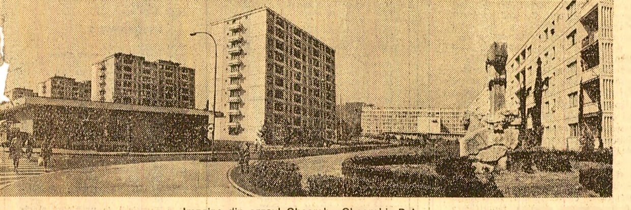
Imagine din orașul Georgehe Gheorghiu-Dej