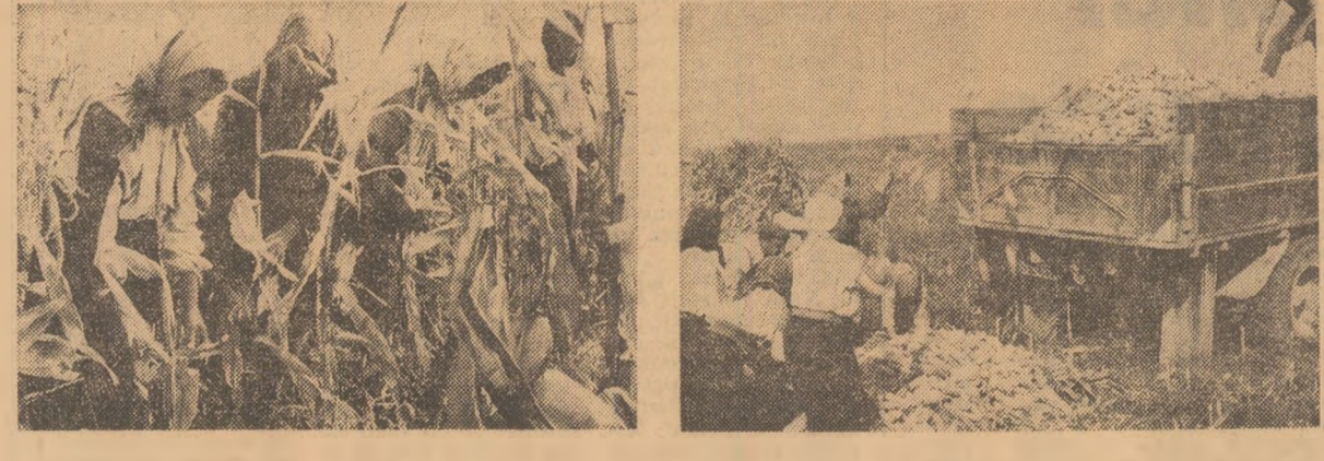
În județul Bacău, recoltarea, transportul și depozitarea porumbului sînt în plină desfășurare. Aspecte de muncă din lanurile cooperativelor agricole Faraoni (fotografia din stînga) și Nicolae Bălcescu (fotografia din dreapta)