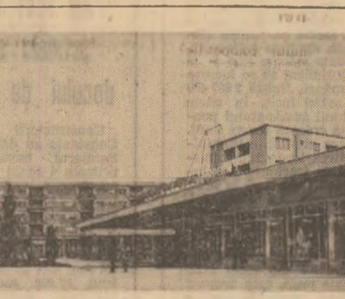
Magazinul universal „Modern” din Slobozia

Magazinul universal „Modern” din Slobozia este minnat de unele comportări ale lui. Un comportament corect în muncă, în societate, în viața particulară și se cere odată cu cetățeanul. Un membru al partidului este o dată în plus, obligat, prin prevederile statutului, prin Codul etic comunist, nu numai să reprezinte un exemplu de comportament în toate împrejurările, dar și să militeze, prin toate mijloacele, pentru traducerea în fapt a principiilor eticii și echității socialiste, pentru ca aceste principii să devină modă de a gândi, act de conștiin-