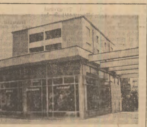
Magazinul universal „Modern” din Slobozia

Este necesar să se organizeze sistematic, așa cum prevede Statutul partidului, consfătuiri cu activul pentru a dezbate cele mai importante aspecte ale muncii de partid, economice și sociale. să se urmărească cu toată atenția eficiența practică a diferitelor forme de pregătire a activului, eficiența ce trebuie să-și găsească reflectarea în creșterea competenței cadrelor, a capacității lor de a rezolva în cele mai bune condiții sarcinile în muncă, în activitatea practică pentru îndeplinirea sarcinilor ce asigură cel mai bine creșterea și educarea cadrelor din activul de partid, dezvoltarea spiritului lor revoluționar, de abnegație, perfecționarea lor ca militanți comunisti.