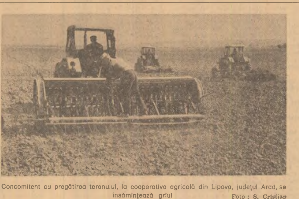
Concomitent cu pregătirea terenului, la cooperativa agricolă din Lipova, județul Arad, se însămintează griul