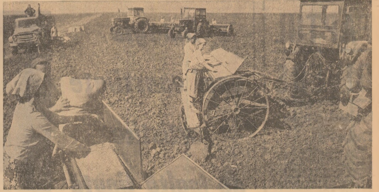
Prin lucrări de bună calitate la semănat, membrii cooperativei agricole și mecanizatorii din Furculești, județul Teleorman, vor să reediteze succesul din acest an: obținerea unei recolte mari de grâu la hectar