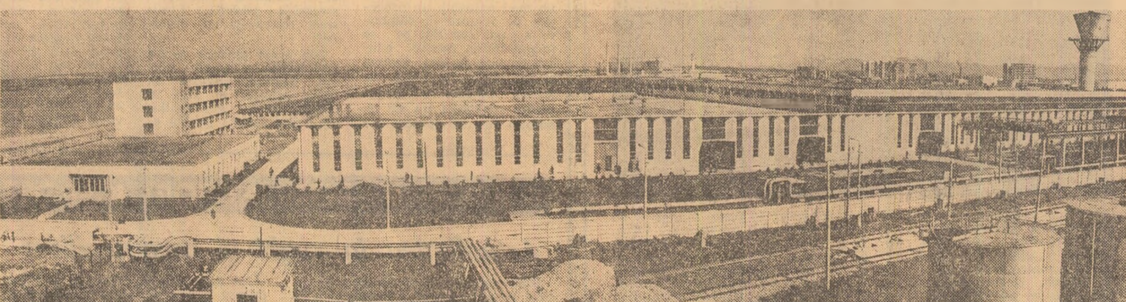
Una din noile unități industriale ale municipiului Tirgoviste: întreprinderea de strunguri.