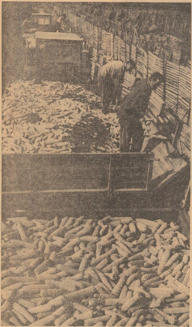
Aspect, în aceste zile, la baza de recepție — Arad

La recenta ședință a Comitetului Politic Executiv al C.C. al P.C.R. s-a subliniat necesitatea ca Ministerul Agriculturii, Uniunea Națională a Cooperativelor Agricole de Producție, consiliile populare și unitățile agricole să ia măsuri hotărâte pentru urgentarea și încheierea în cât mai scurt timp a recoltării, îndeosebi la porumb, cartofi, sfeclă de zahăr, legume și altele, pentru transportarea și immagazinarea lor în bune condiții, asigurându-se astfel integral baza materială necesară pentru o bună aprovizionare a populației cu produse agroalimentare. Cum se acționează pentru îndeplinirea acestor sarcini și, îndeosebi, pentru urgentarea recoltării, transportului și depozitării porumbului? Iată câteva concluzii desprinse din raidul-anchetă întreprins în județele Ialomița, Bihor și Cluj.