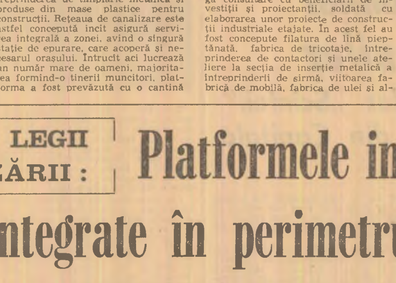
Reșția. Vedere din centrul orașului.

Programul de sistematizare a localităților buzoiene a cunoscut o etapă deosebită în perioada 1973, cu prilejul vizitei de lucru întreprinse în județul nostru de tovarășul Nicolae Ceaușescu. Indicațiile primite atunci au constituit direcții concrete de acțiune în vederea adoptării de soluții eficiente pentru asigurarea în cel mai înalt grad de funcționalitate a obiectivelor și o rațională ocupare a terenului — atât în amplasarea unităților economice, cit și a construcțiilor de locuințe sau social-cultural.