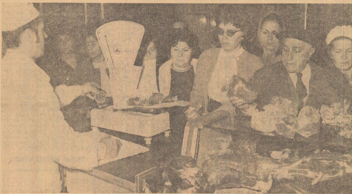
Într-un magazin alimentar din Drumul Taberei. Au sosit mărfuri proaspete