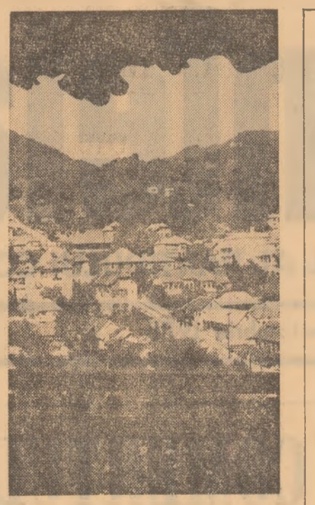
Peisaj din stațiunea balneoclimateric Olănești

În spiritul legii sistematizării, platformele industriale — armonios integrate în perimetrul orașului — vor ocupa decît o suprafață redusă cu peste 40 la sută față de cel ce ar fi considerat necesar mai înainte. Asigurarea unei dezvoltări armonioase a municipiului, în concordanță cu obiectivele economice și sociale prevăzute pentru viitor, impune o soluționare eficientă a amplasării și realizării ansamblurilor de locuințe, a celorlalte dotări social-culturale ce vor fi construite. Orașul Buzău a moștenit un fond de clădiri, în bună parte vechi, cu densitate scăzută, care pun o serie de probleme urbanistice. Schita de sistematizare a urmărit crearea unei zone centrale reprezentative, care să păstreze elemente specifice, în așa fel încît clădirile de importanță socială să fie in-