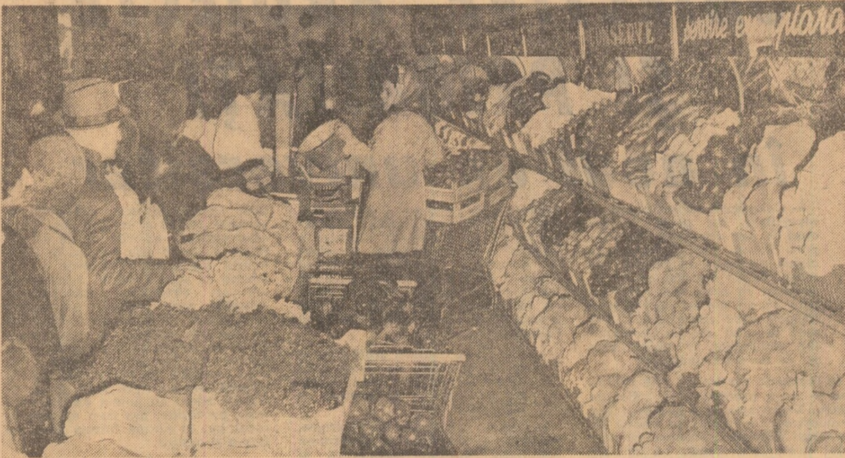
Magazinul „Fortuna” din București. Într-un asemenea magazin faci cumpărături cu plăcere