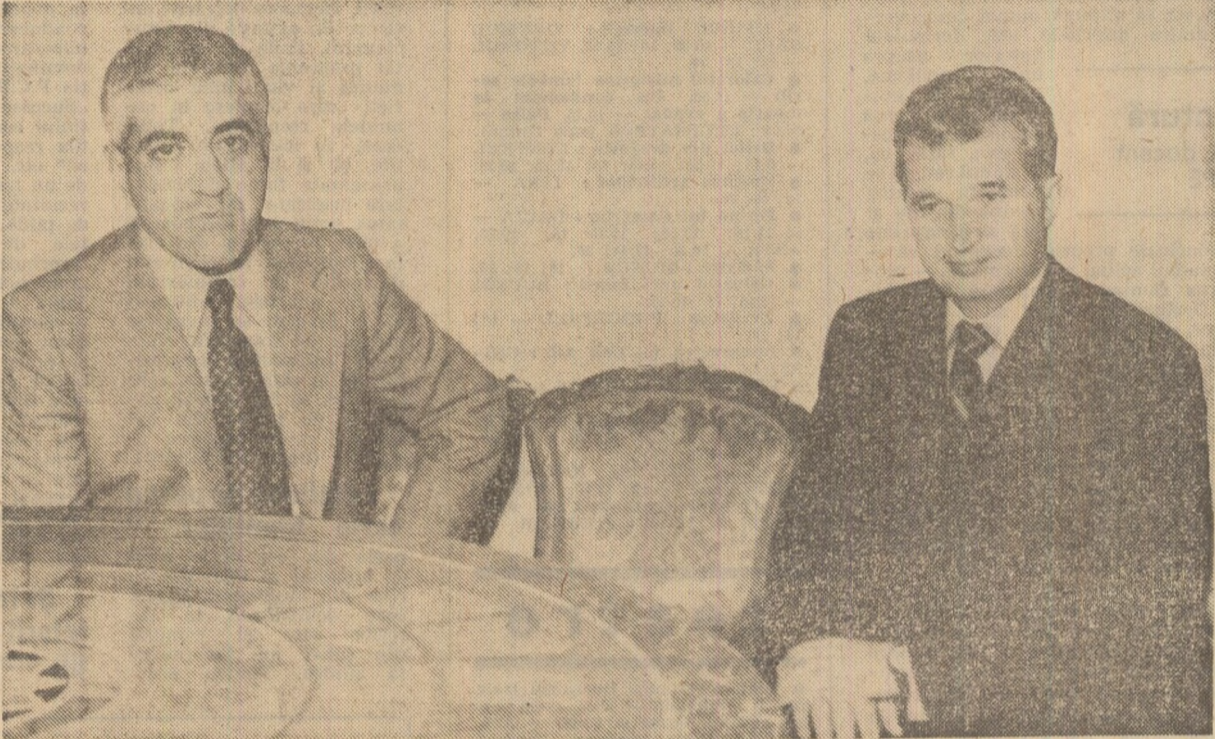
Primirea generalului Otelo Saraiva de Carvalho