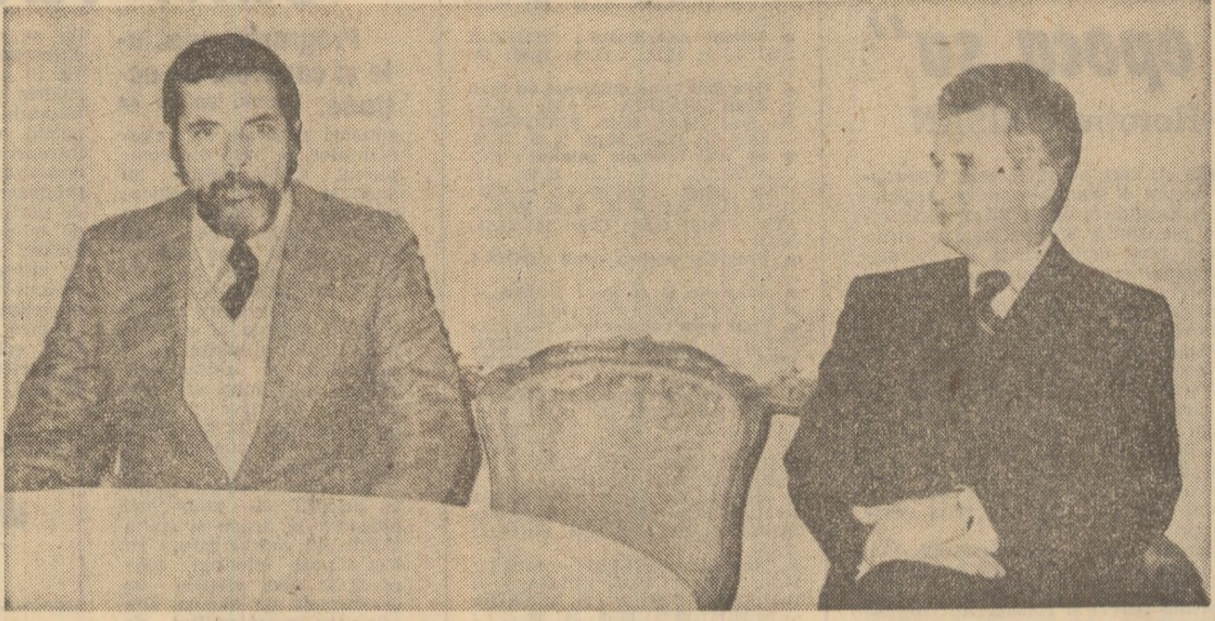
Primirea generalului Carlos Fabiao