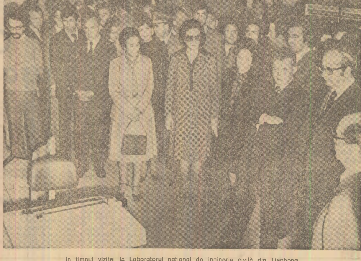
În timpul vizitei la Laboratorul național de inginerie civilă din Lisabona