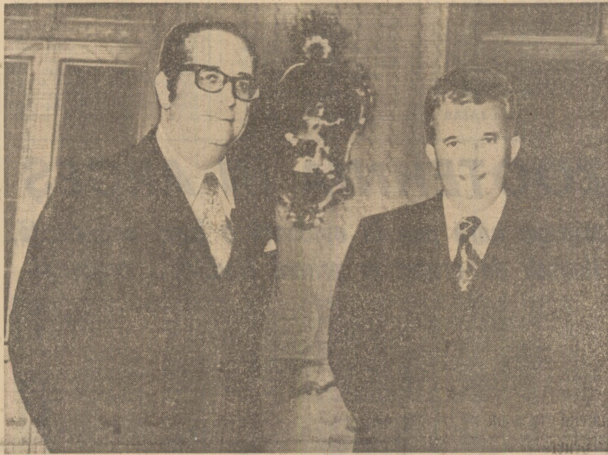
Cei doi președinți înaintea convorbirilor oficiale