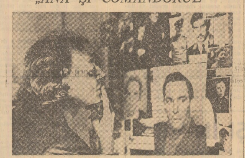
Producție a studioului A. P. Dovjenko. Regia: Evgheni Hrinuik