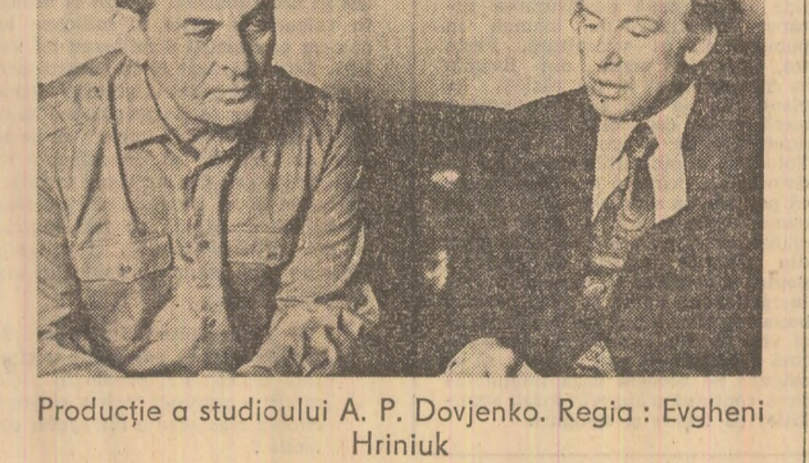
Producție a studioului A. P. Dovjenko. Regia: Evgheni Hrinuik