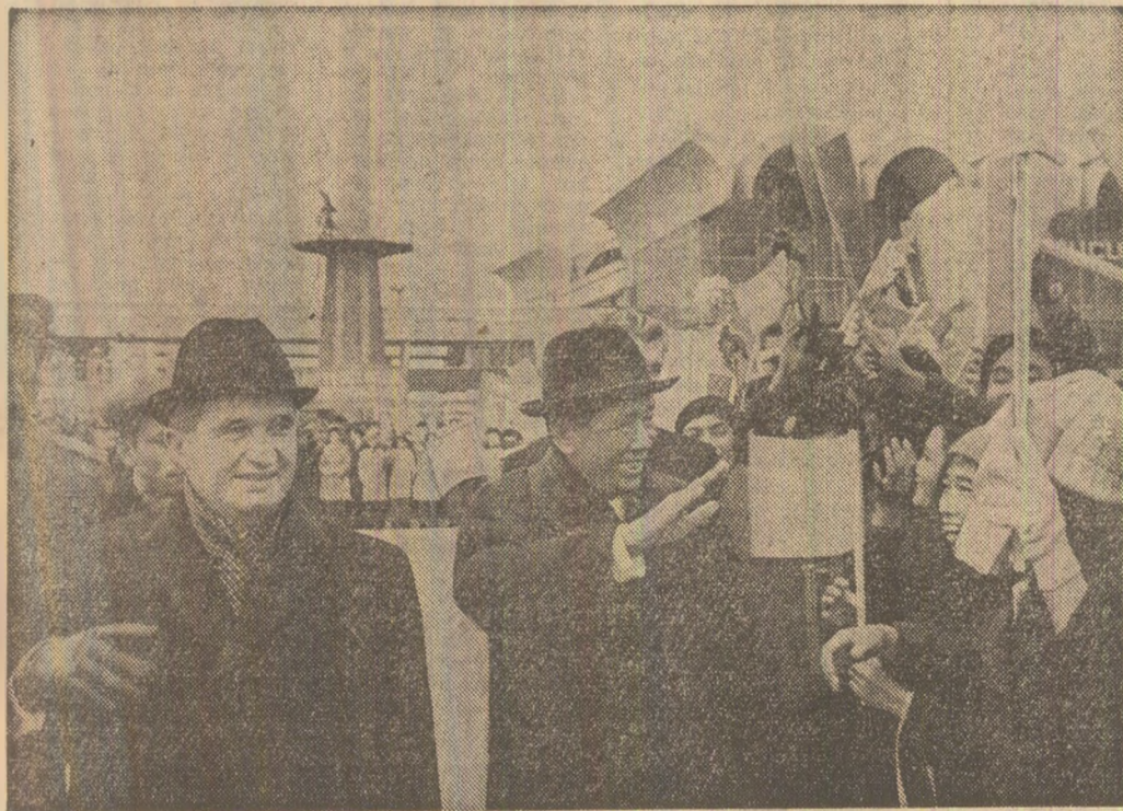
Mii de bucureșteni întîmpină cu căldură însuflețită și aleasă stimă pe cei doi conducători de partid

mergătoare convorbirilor oficiale s-a desfășurat într-o atmosferă de căldură prietenească, de stimă și înțelegere reciprocă, sub semnul dorințelor comune de a extinde și întări relațiile de solidaritate și colaborare multilaterală dintre partidele, țările și popoarele noastre, de a dezvolta conlucrarea dintre ele, atât pe tărîmul construcției socialiste din cele două țări, cât și în domeniul vieții internaționale, pentru triumful cauzei socialismului și păcii în lume.