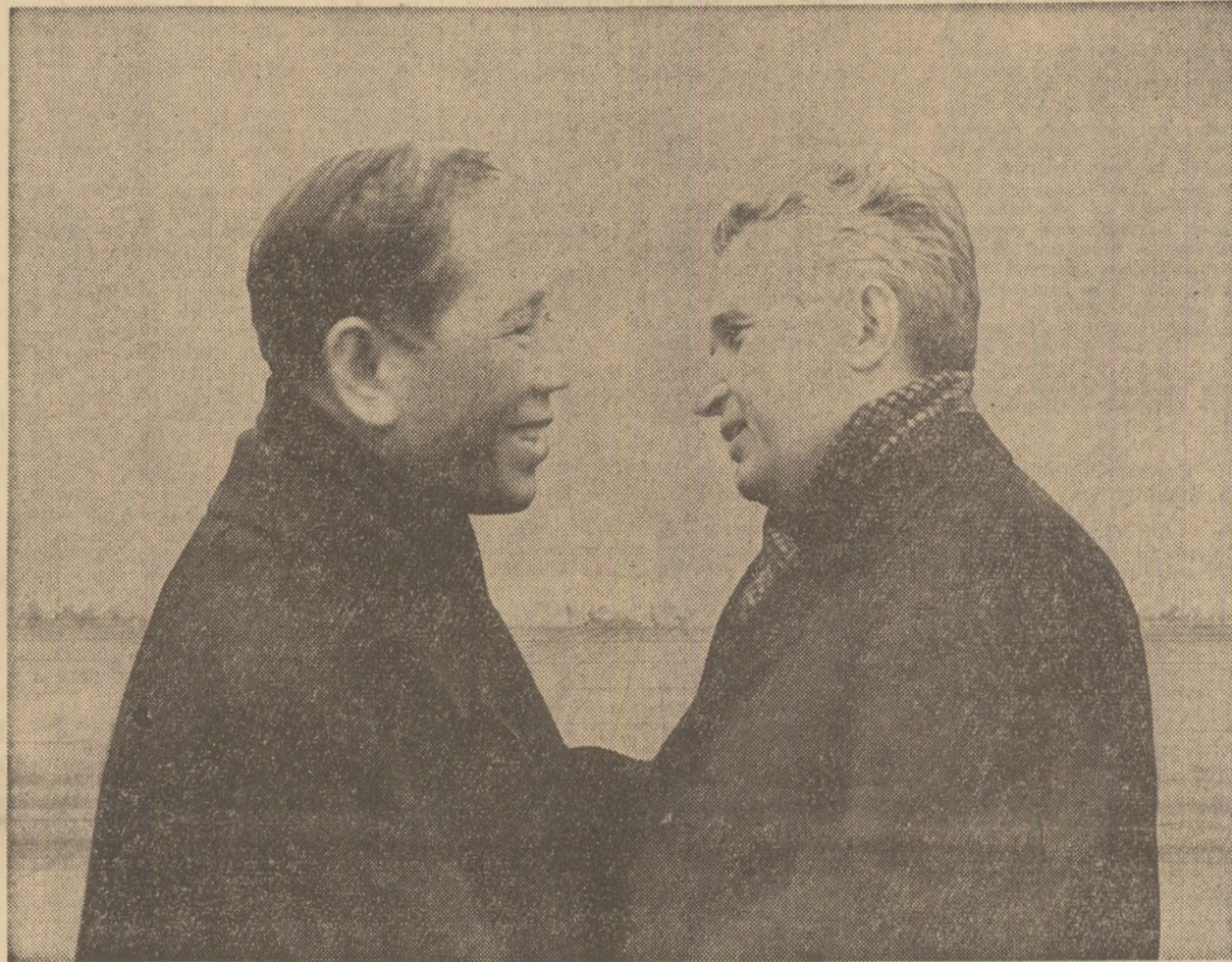
La sosire, pe aeroportul Otopeni

Expresie a prieteniei și solidarității militante dintre partidele, popoarele și țările noastre, vizita înaltului reprezentant al Vietnamului eroic pune în evidență hotărîrea comună de a întări conlucrarea frățească româno-vietnameză, contribuție de seamă la marea cauză a unității țărilor socialiste, a luptei antiimperialiste, pentru pace și libertate în întreaga lume