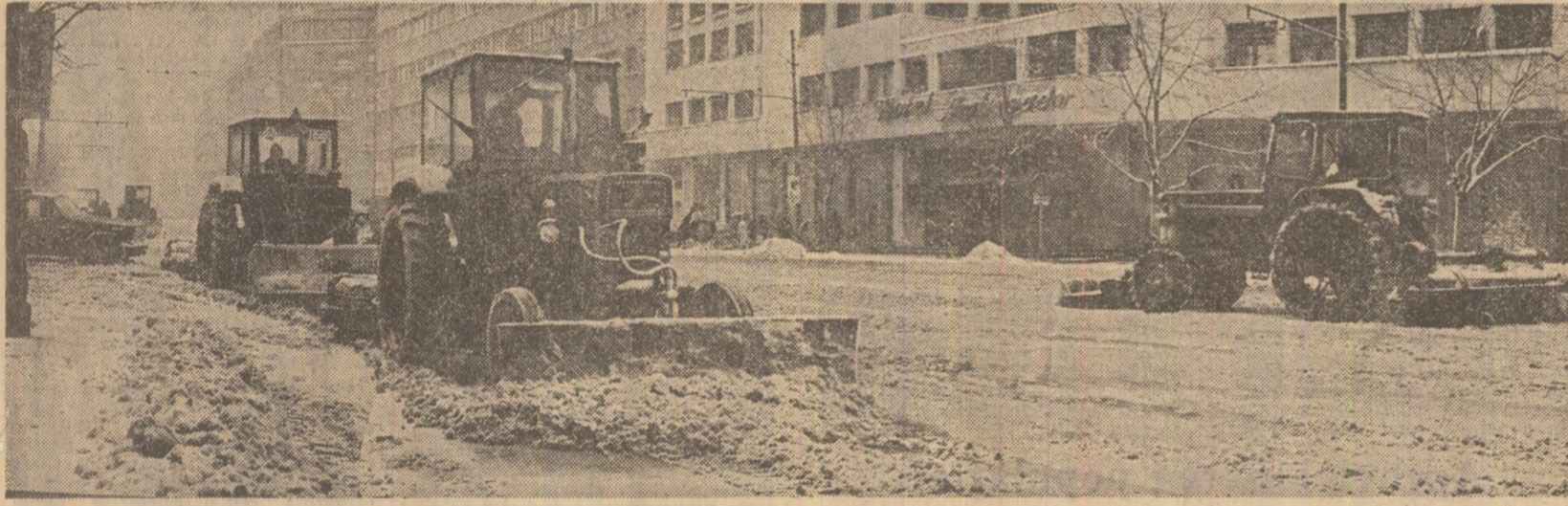
În Capitală, sute de utilaje degațează zăpada de pe bulevarde și străzi.

Prind viață hotărârile Congresului al XI-lea al P. C. R.