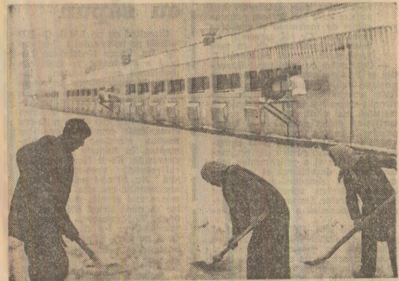
Unde este bună organizarea, lopata face munca în drumul spre pășuni, ouă și tot ceea ce trebuie pentru buna aprovizionare a populației...