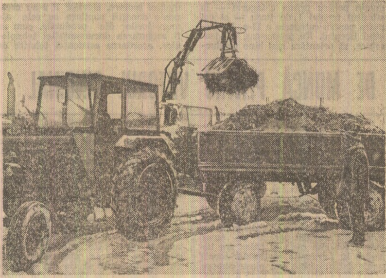
Ninge și viscoluște, dar animalele trebuie hrănite. Nici un efort nu este prea mare pentru a asigura desăvârșirea normală a activității în zootehnie...