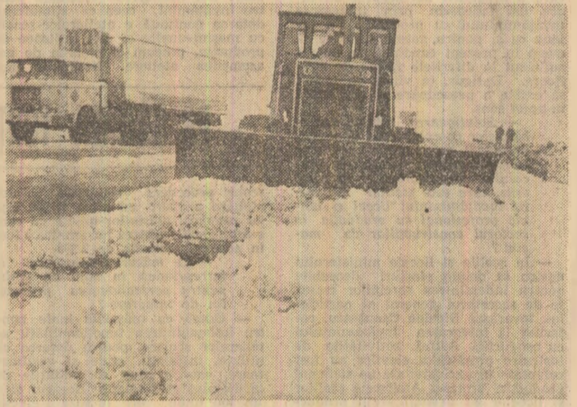
Tehnica și organizarea sint mai tari ca viscolul. Puterful buldozer a făcut o mișcare spre stînga pentru a face loc autocamionului care transportă alimente...