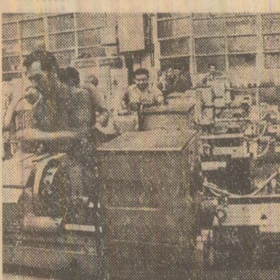
În acest an, la Întreprinderea de strunguri din Arad au fost concepute, proiectate și introduse în fabricația curentă numeroase mașini-unelte moderne, de înalt randament. Imaginea redă hala de montaj a întreprinderii

Dintre articolele mult solicitate pentru sezonul rece, magazinele cooperative de consum oferă sobe de încălzit, calorifere electrice, mașini de gătit, precum și materiale de construcții și de întreținere a gospodăriei ca: ciment, var, vopsele, pensule și altele.