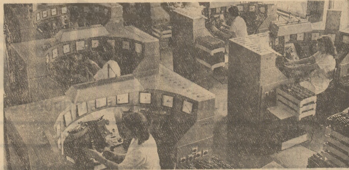
Întreprinderea „Electroapara” din Capitală este dotată cu tehnică modernă, de înalt randament. Aprecierea este întîrită de imaginea atelierului pupitelor de reglaj termic, unde se probează calitățile unor instalații.