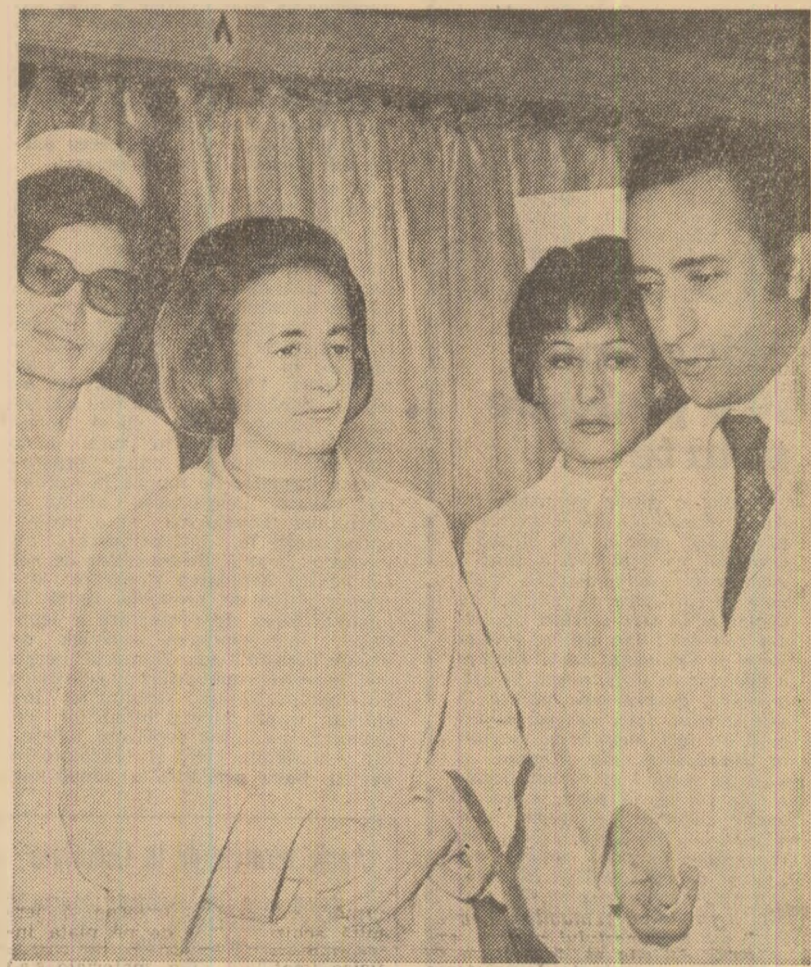
Relatarea vizitei și telegrafurile au fost realizate de specialiștii Agenției PARS.

Caracterul deosebit de rodnic al concilierii pe asemenea trairnice temeiuri dintre România și Iran a fost subliniat, de asemenea, în comentariile de la radio și televiziune. Referitor la toastrile rostite de cei doi șefi de stat, a fost relevat faptul că președintele Nicolae Ceaușescu a subliniat că „în ultimii ani relațiile dintre România și Iran au cunoscut