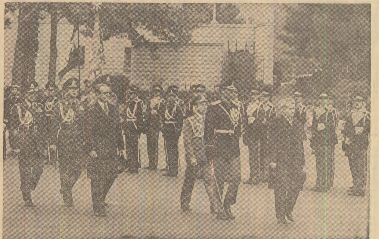
Doă imagini de la plecarea din Teheran