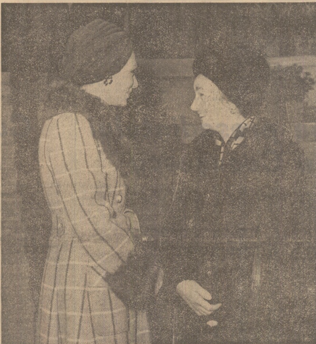
Înainte de a părăsi capitala Iranului, președintele Nicolae Ceaușescu și tovarășa Elena Ceaușescu se întrețin cordial cu Șahinșahul Aryamehr și împărăteasa Farah