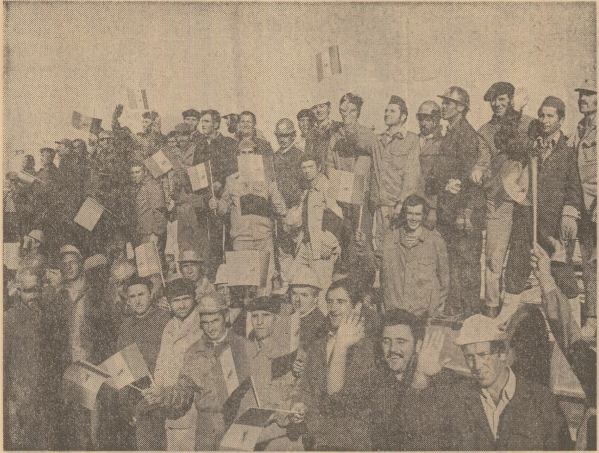
Manifestări de dragoste și bucurie din partea muncitorilor de pe șantierul Bandar Shahpour