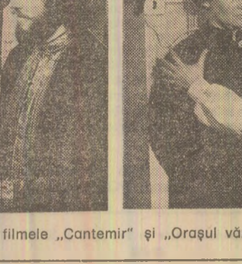
Scene din filmele „Cantemir” și „Orașul văzut de sus”