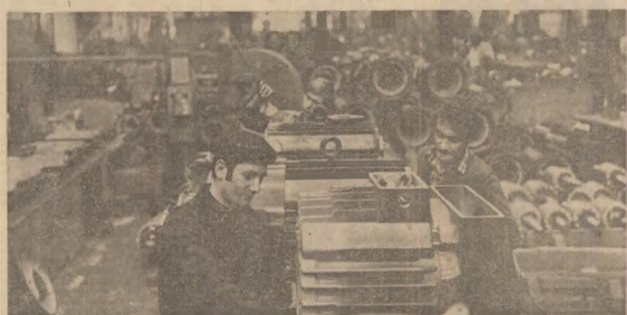
Întreprinderea de mașini electrice din Capitală. În imagine: secția montaj II, al cărei colectiv este frunțat în întrecere.