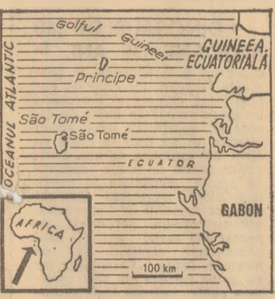
Una din primele măsuri luate de către guvernul țerei republicii după cucerirea, la 12 iulie 1975, a independenței...