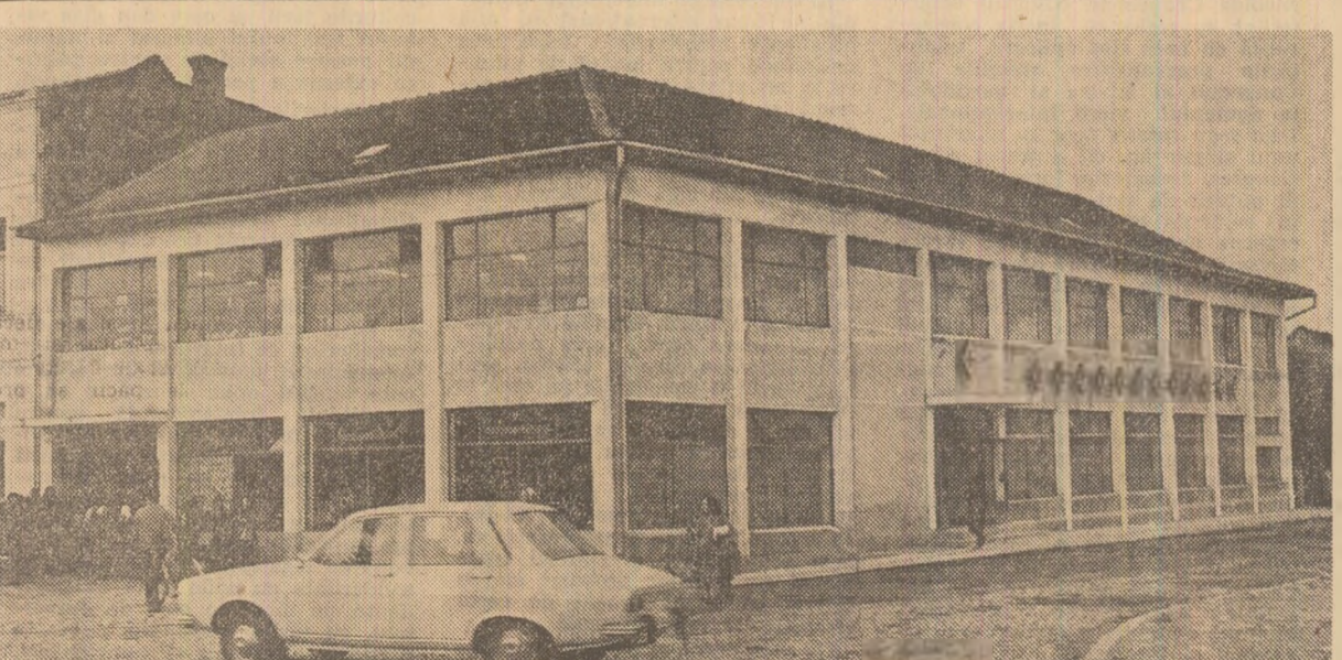
În comuna Crasna din județul Sălaj a fost dat în folosință un nou și modern magazin universal.

Constantin SIMION corespondentul „Științei”