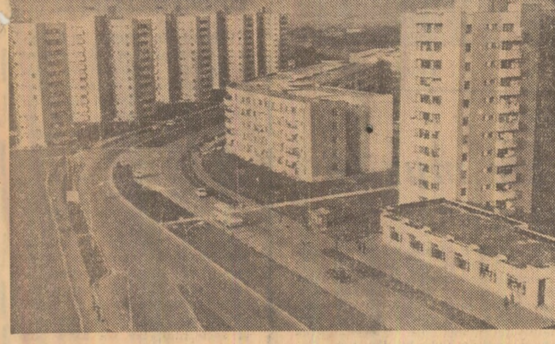
Cincinalul actual a marcat înfăptuirea unui program de investiții fără precedent în tumultuoasa istorie a construcției socialiste din patria noastră. Pretutindeni au apărut în acești ani mari unități economice, obiective social-culturale, vaste ansambluri de locuințe.