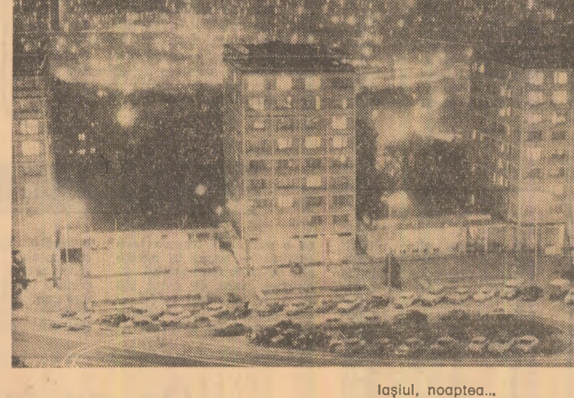
În sala radioteleviziunii.