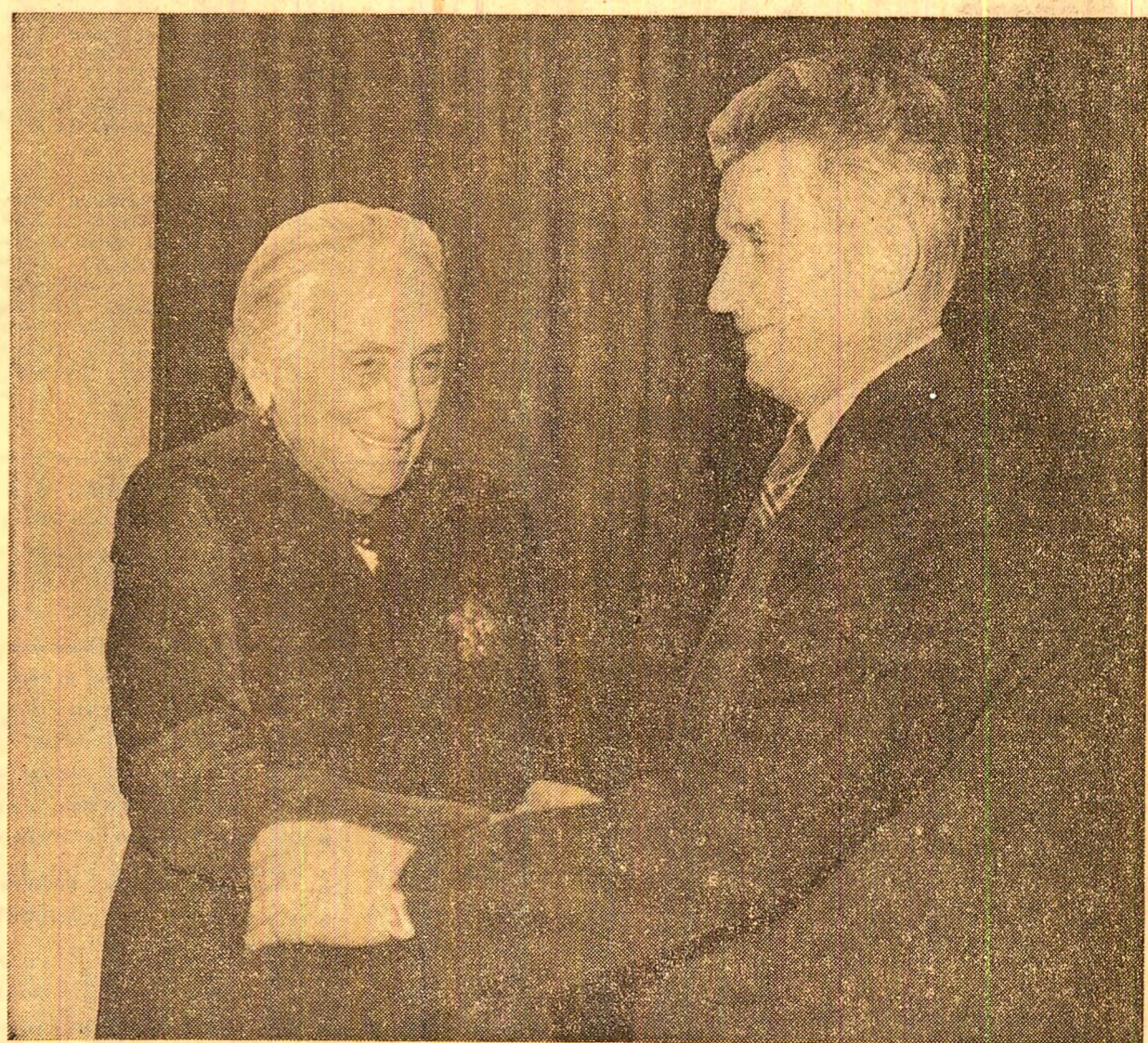
DUPĂ ÎNMÎNAREA ÎNALTEI DISTINCȚII, TOVARĂȘUL NICOLAE CEAUȘESCU FELICITĂ CU CALDURA PE TOVARĂȘA DOLORES IBARRURI