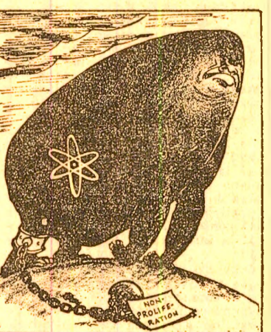
Iată cum vede revista americană „TIME” pericolul proliferării armei nucleare: un monstru capabil oricînd să rupă cu ușurinţă firavul ţărîş pe care îl reprezintă reglementările, a totu insuficiente, de împiedicare a diseminării dispozitivelor atomice.