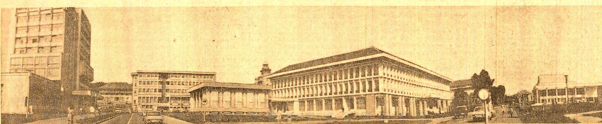
Cu fiecare an, Zoidul — asemena tuturor orașelor țării — devine tot mai frumos

În înfăptuirea vastului program de dezvoltare pe multiple planuri a țării noastre, stabilit de Congresul al XI-lea al Partidului Comunist Român, industria constructoare de mașini este chemată să contribuie la înzestrarea economiei naționale cu tehnică modernă, să realizeze utilaje complexe, mașini, instalații, aparatură de înalt nivel.