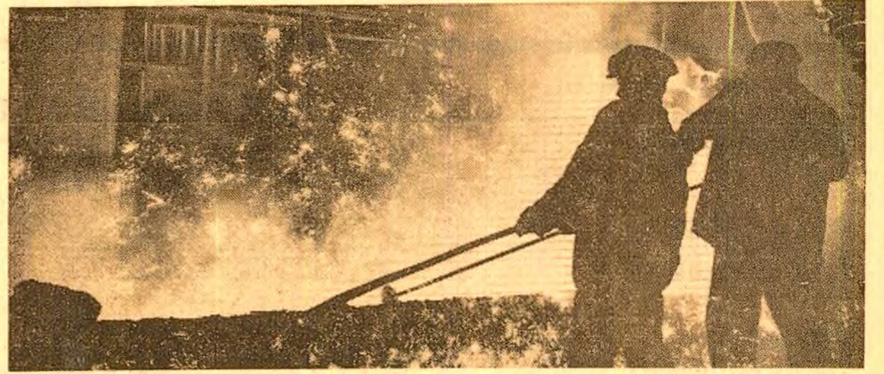
Combinatul siderurgic Hunedoara. De aici a pornit chemarea către toate întreprinderile industriei metalurgice