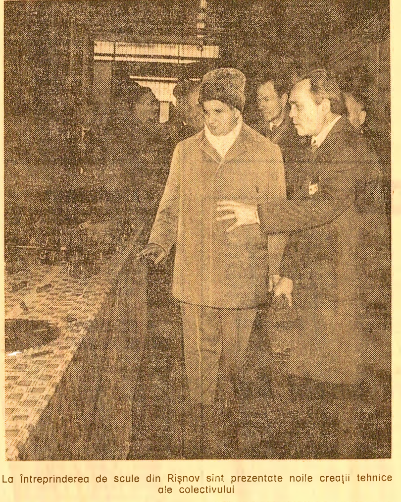
La întreprinderea de scule din Rîșnov sint prezentate noile creații tehnice ale colectivului

și modernă unitate. Este vorba de complexul turistic „Bucovina” din Suceava. Complexul se compune dintr-un hotel cu 252 locuri în camere confortabile, dispunând totodată de spații destinate alimentației publice, un restaurant cu o capacitate de 200 locuri, o cafeterie, un bar de zi și o torasă. (Gh. Parascan). TIMIȘ. La Buziaș a început construcția unui modern cinematograful cu 500 locuri, prevăzută cu ecran lat. În ultima vreme, în orașul-stațiune au fost date în folosință alte obiective social-culturale și edilitar-gospodărești, între care un hotel balnear, o cantină, o creșă și o grădi-