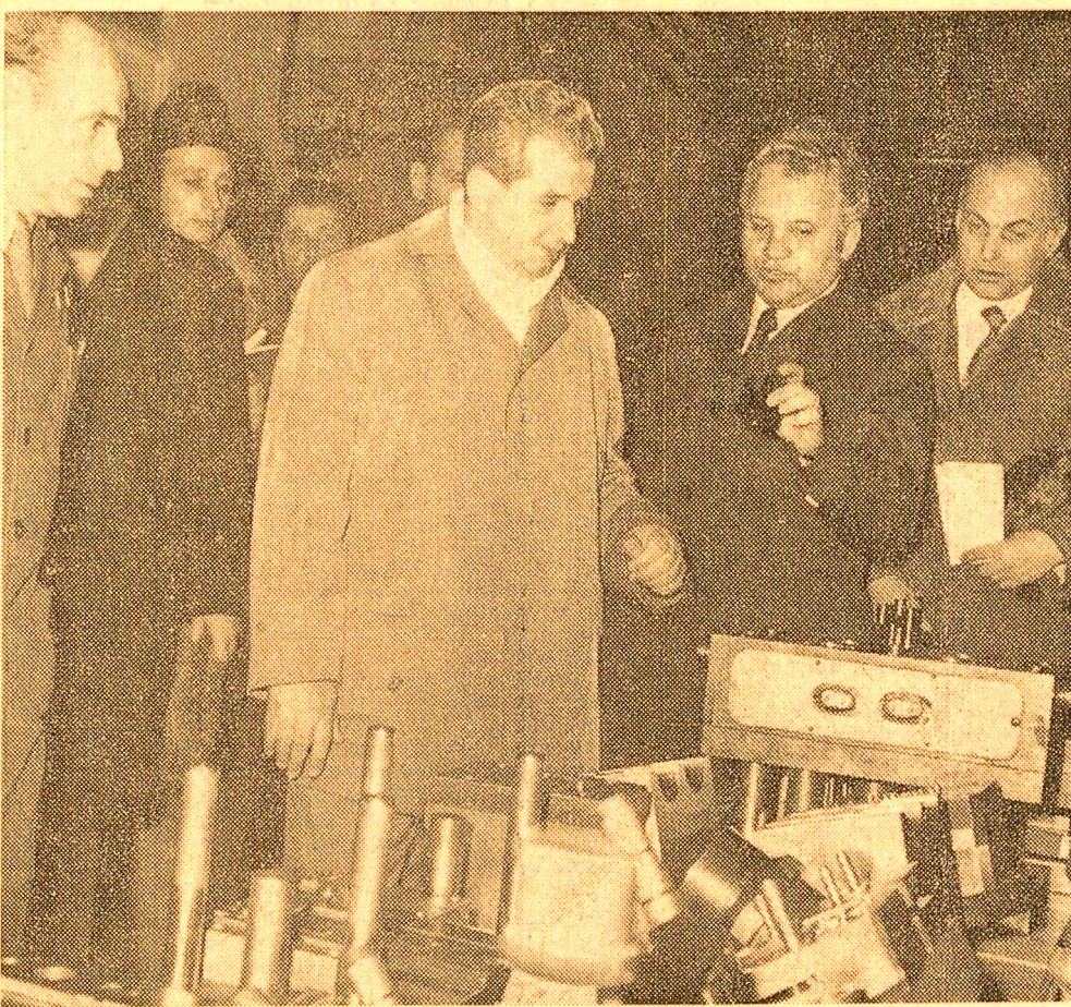
La întreprinderea „Electroprecizia” din Săcele

În întîmpinarea Congresului consiliilor populare