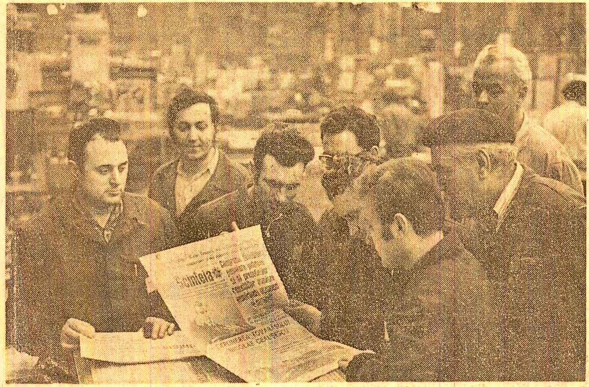
Imaginea este de la întreprinderea „23 August” din Capitală, dar putea fi de la oricare întreprindere din țară. Au sosit, așteptate cu nerăbdare și viu interes, ziarele în care este publicată Expunerea tovarășului Nicolae Ceaușescu la marelui forum al poporului. În prima pauză de lucru — primele comentarii însuflețite, străbătute de hotărîrea de a munci mai bine, pentru traducerea în viață a lăunioaselor obiective cuprinse în expunere.