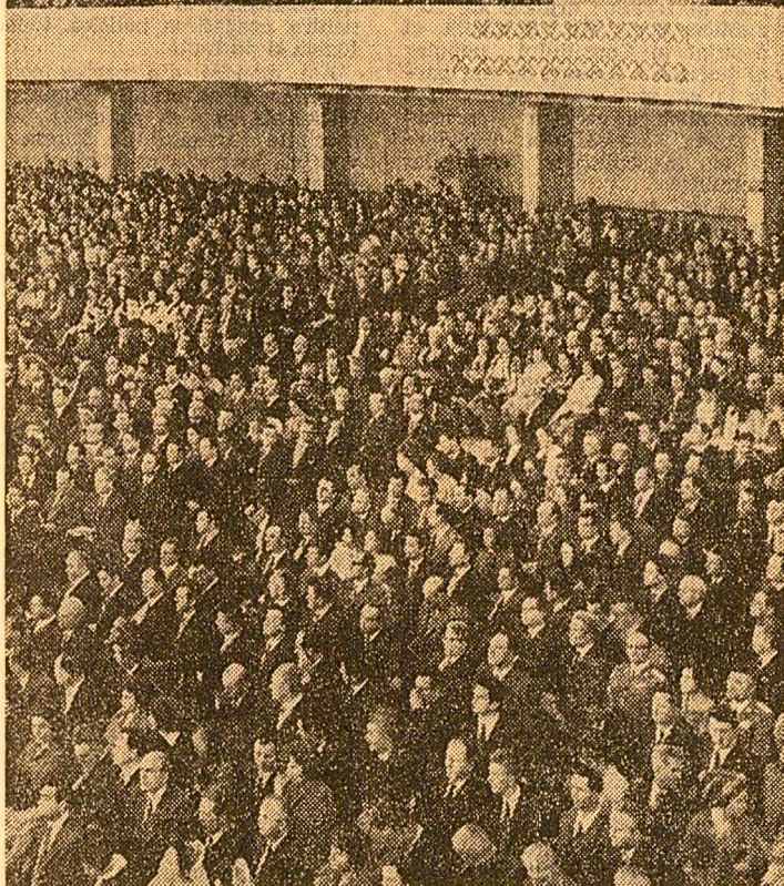
(Urmare din pag. a IV-a)

privite la dezvoltarea viitoare a patriei noastre socialiste. In cuvintul meu doresc să mă refer la unele probleme prevăzute in Programul pentru conservarea și dezvoltarea fondului forestier, program care reprezintă o materializare a politicii consecvente a partidului de dezvoltare multilaterală a țării pe baza valorificării superioare a resurselor existente in fiecare domeniu. Județul Caras-Severin dispune de un fond forestier de aproape 400 mii ha și a furnizat anual 1,3 milioane metri cubi masă lemnoasă. In cincinalul trecut au fost realizate împăduriri pe suprafețe de 17.900 hectare, din care aproape 1.000 hectare in fondul forestier din administrarea directă a comunei. S-au executat lucrări de refacere și substituție a pădurilor slab productive pe suprafață de 2,3 ori mai mare decât in perioada 1966-1970. De asemenea, s-au împădurit suprafețe insemnate de terenuri degradate, situate in bazinele hidrografice din zona ciferină și montană. In jurul municipiului Resița au fost realizate împăduriri — lucrări ce s-au dovedit de o mare importanță pentru ameliorarea mediului inconjurător, pentru purificarea aerului, precum și pentru agrement și refacere. In cadrul lucrărilor de împădurire au fost utilizate atât specii locale, precum — brad, gorun, frasin,