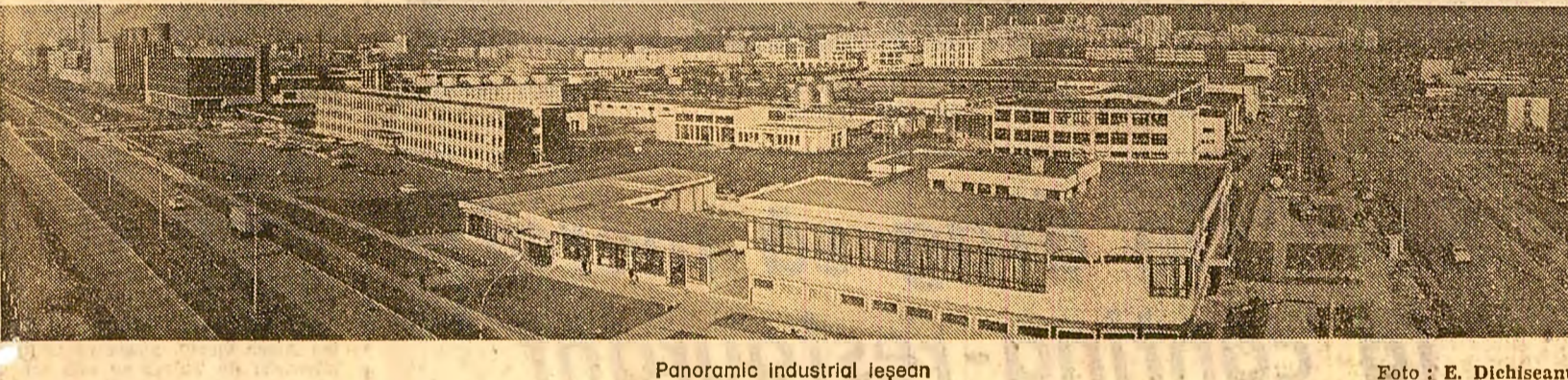
Panoramic industrial Ieșoan

Este un argument material care justifică afirmarea în permanență actualitate a acțiunii de organizare științifică a producției și a muncii.