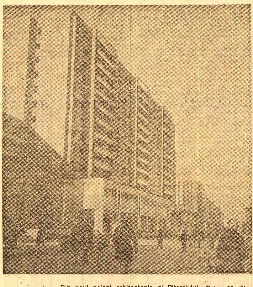
Din noul polsaj arhitectonic al Piteștilului

Prin „clauza de împuternicire”, dreptul de dispoziție asupra depunerilor poate fi acordat la cel mult două persoane. Beneficiar al unui „dispoziție testamentare” pot fi una sau mai multe persoane. Depunerile asupra cărora nu s-au dat „dispoziție testamentare” se eliberează de Casa de Economii și Consemnațiuni moștenitorilor legali sau testamentari după cunoașterea calității lor de călători, organice și compoziționale. „Clauza de împuternicire” și „dispozițiile testamentare” pot fi mo-