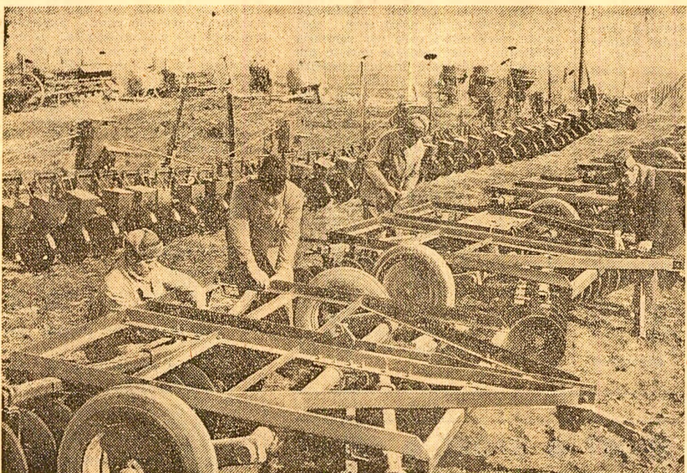
Reparate din timp și cu grijă, mașinile agricole ale secției de mecanizare Sărulțeni au primit la recepție calificații „foarte bine” (fotografia din stânga). Însăși muncitorii au primit la recepție calificații „foarte bine” (fotografia din dreapta). La cooperativa agricolă Fundulea se transportă îngrășămintele chimice (fotografia din mijloc).