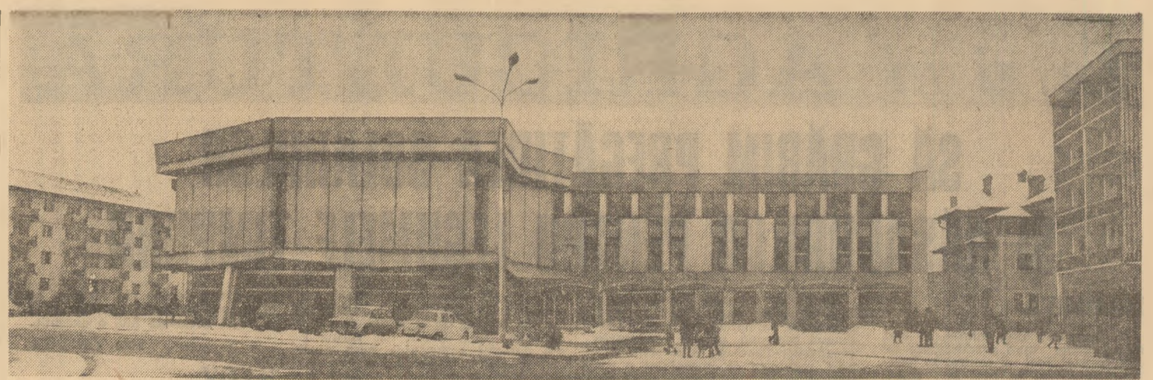
Noua Casa de cultură a sindicatelor din Cimpulung, județul Argeș

Una din cerințele principale ale acestor lucrări este de a forma o echipă de studenți care să dețină conținutul său teoretic. Și această cerință decurge tot din necesitatea pregătirii tineretului în strânsă legătură cu imperatiile producției și practicii sociale. Înțelegerea acestui sens al pregătirii științifice a studenților implică, înainte de toate, excluderea din cursuri și prelegeri, ca și din dezbaterile cu caracter de seminarizare, a celorlalte teme și probleme care nu prezintă decât un interes istoric limitat (sau uneori nici atât), care nu vor fi folosite în nici un fel conținutului lor de cunoștințe științifice.