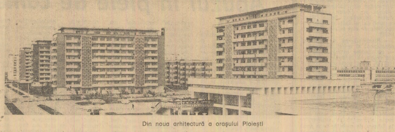
Din noua arhitectură a orașului Ploiești