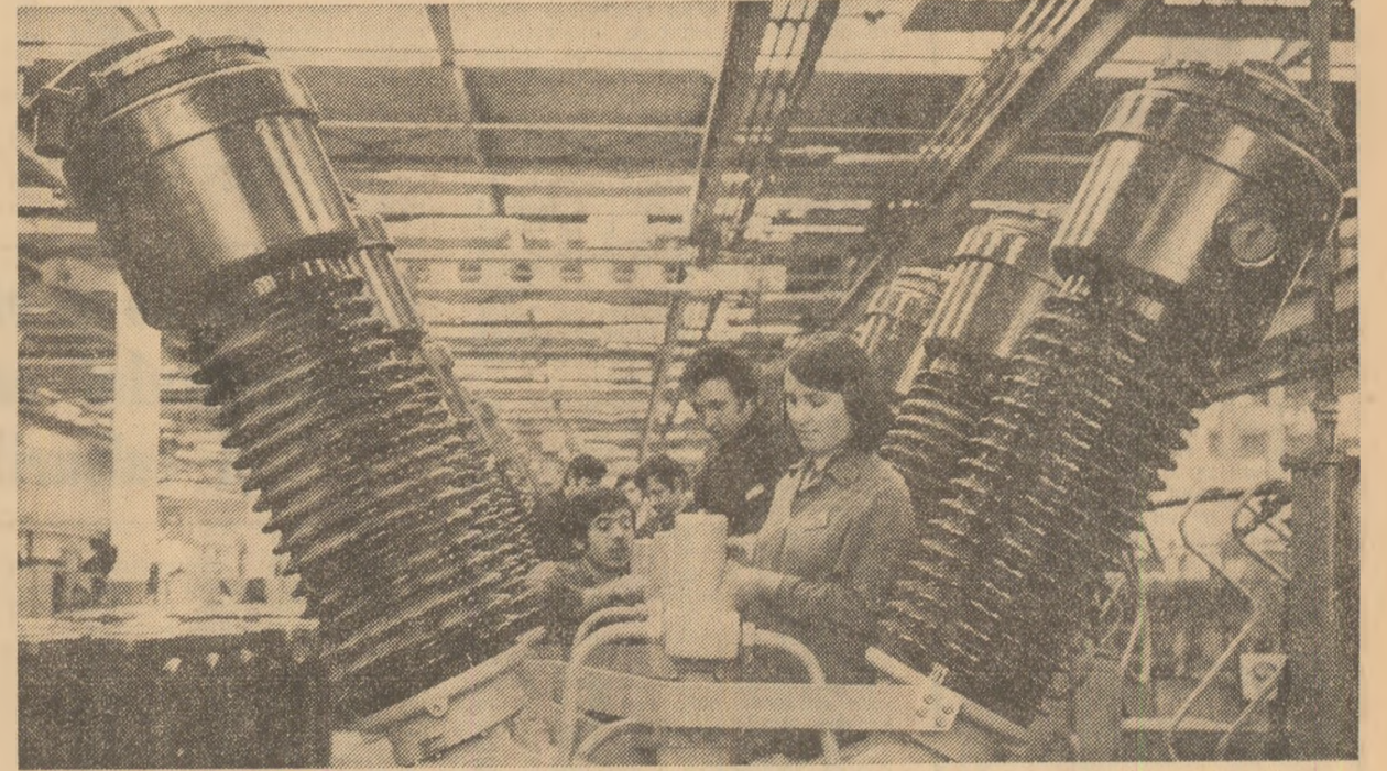
La întreprinderea „Electroputere” din Craiova: se montează un lot de intrerupătoare

și a doamnei Norryyah Al-Sabah, în ultima parte a lunii martie 1976.