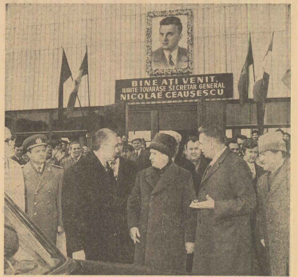
La Institutul central de cercetări metalurgice

Atenția secretarului general al partidului a fost reținută, de asemenea, și de alte aspecte economice și tehnice ale activității Institutului de cercetare și proiectare din domeniile electronicii, electrotehnicii, automatizării, mecanicii fine și mașinilor-unelte. Analizînd, împreună cu gazde-