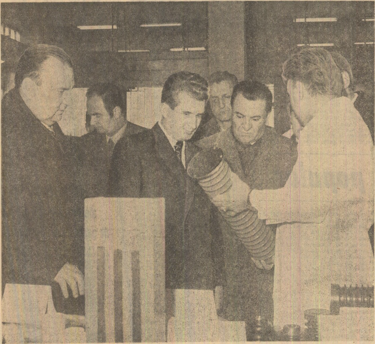
La Institutul central de cercetări pentru electronică, electrotehnică, automatică, mașini-unelte și mecanică fină