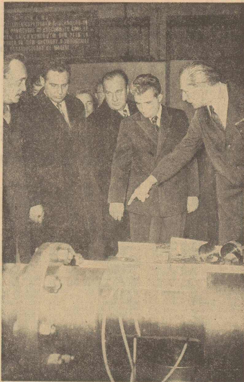
La Institutul central de cercetări pentru construcții de mașini

Avem în fața un cincinal hotărât, subliniază tovarășul Nicolae Ceaușescu. Acum disuneți de oameni valoroși, de mijloace necesare. Trebuie să vedem grație faptului de intrare în producție a viitoarelor obiective și să facem totul pentru scurtarea termenelor de punere în funcțiune, pentru asimilarea cât mai rapidă a noilor produse și tehnologii. Chimia trebuie să facă în cincinal un pas important înainte alți în sfera cuprindeți, cit și a calității produselor, de la cercetare fundamentală pînă la realizarea obiectivelor industriale.