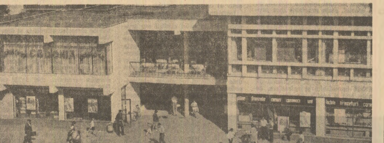
Complexul comercial din cartierul „Hipodrom” — Sibiu.

Constantin CAPRUR corespondentul „Scintilei”