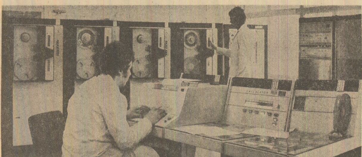
Calculatorul „Felix-C 256” este binevenit la întreprinderea „Industria sirmel” din Cimpia Turzii. Cu ajutorul lui se dirijează mai rațional procesul de producție, se urmărește îmbunătățirea activității economice a marii unități din județul Cluj