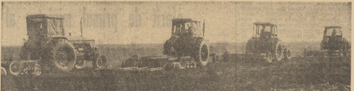
Sămînţa va fi pusă în pămînt bun. În acest scop, la C.A.P. Fulga, judeţul Prahova, terenul este pregătit cu grijă