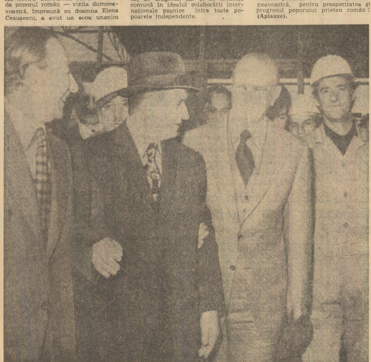
În mijlocul muncitorilor de la Soaramanga

Stimată doamnă Elena Ceaușescu Ridic paharul în sănătatea dumneavoastră, pentru prosperitatea și progresul poporului prieten român! (Aplauze)