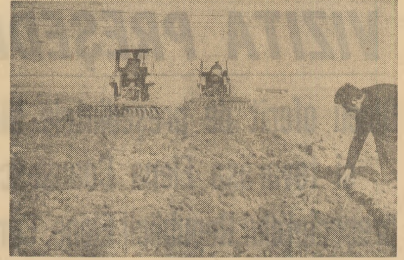
Şi la C.A.P. Cojocna, judeţul Dimboviţa, se urmăreşte îndeaproape ca la pregătirea terenului şi semăntul să se respecte normele agro tehnice.