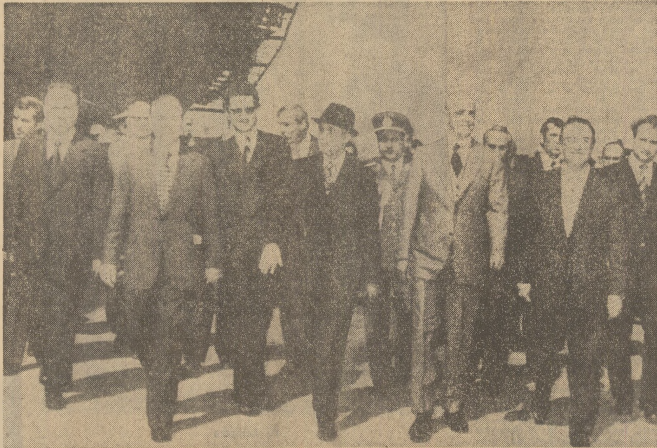
La Șantierul naval de la Scaramanga