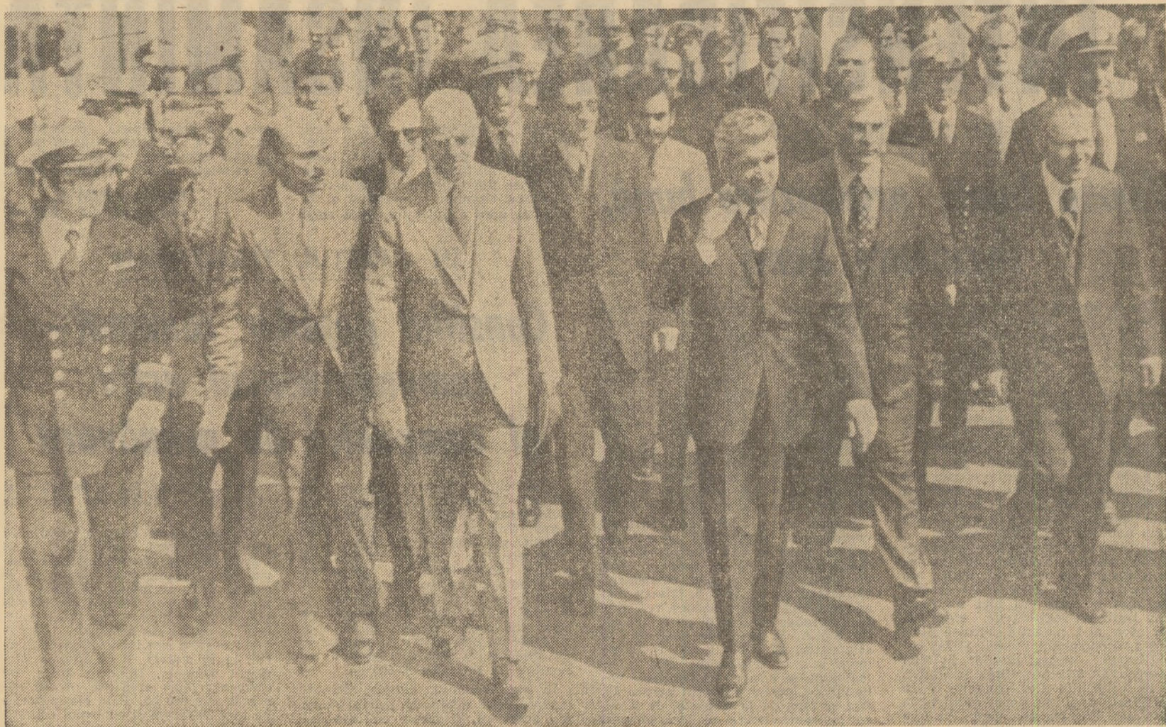
În marele port maritim Piraeus