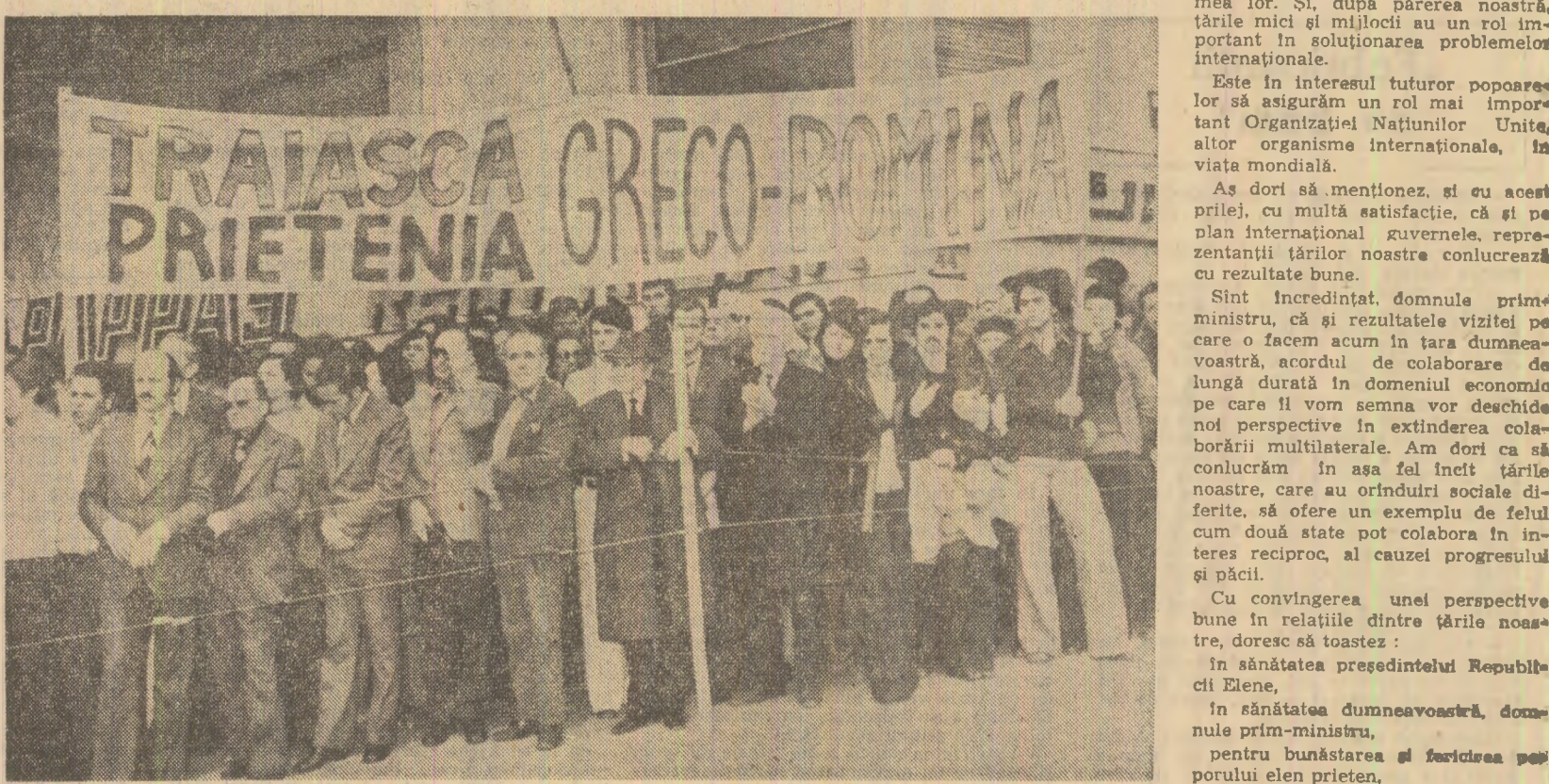
Pe străzile Atenei, populația ovăționează pentru prietenia dintre cele două popoare

As dori să menționez, și cu acest prilej, cu multă satisfacție, că și pe plan internațional guvernele, reprezentanții țărilor noastre conlucrează cu rezultate bune.