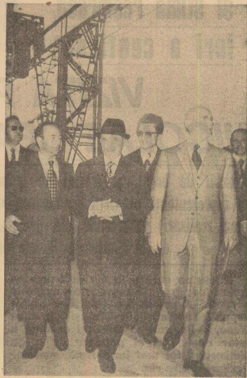
În timpul vizitei la Şantierul naval de la Scaramanga

Înainte de încheierea vizitei, tovarăşul Nicolae Ceauşescu şi tovarăşa Elena Ceauşescu se opresc cîteva momente în faţa Erechtonului, monument ce se remarcă prin fineţea decorativă şi graţia porturilor sale. La reînnoirea, înaltii oaspeţi sînt din nou salutati cu căldură şi simţă de numeroase grupuri de cetăţeni.