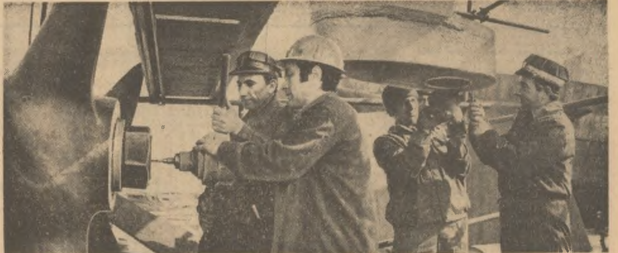
Construcții de nave de la șantierea din Drobeta Turnu-Severin obțin rezultate remarcabile în întrecerea socialistă.