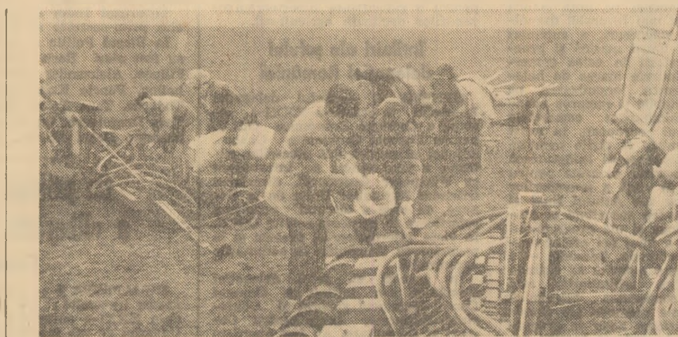
La cooperativa agricolă Movila Banului, precum și în alte unități agricole din județul Buzău, continuă în ritm intens semănatul sîmînței de zahăr (fotografia din stînga). Se construiesc o nouă capacitate de producție în cadrul întreprinderii „Steaua roșie” din Capitală (fotografia din dreapta)