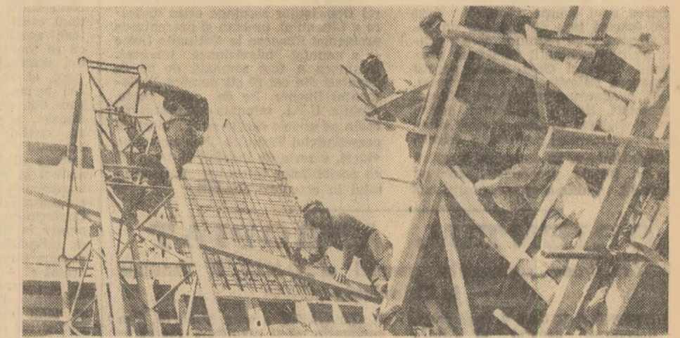
Se construiesc o nouă capacitate de producție în cadrul întreprinderii „Steaua roșie” din Capitală (fotografia din dreapta)