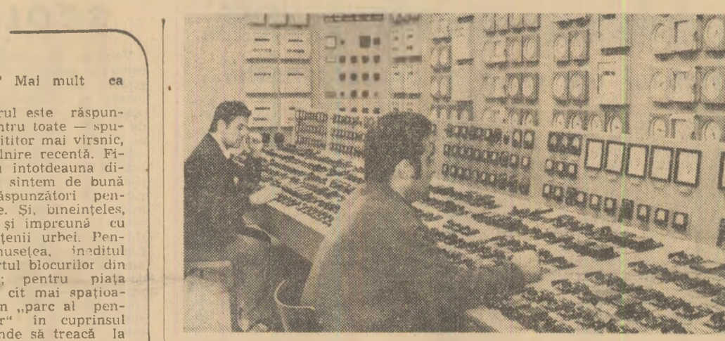
Camera de comandă a Termocentralei Mintia-Deva. Energeticienii de aici au produs suplimentar, de la începutul acestui an, peste 32 milioane kWh

Octav GRUMEZA corespondentul „Scintilei“